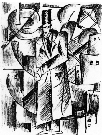
Мужчина на фоне города. Эскиз. 1920-е

или в большое агитационное панно ("Рабочие и буржуи").