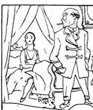
3. В Париже с сбывшим ус. пехом шел пикантный фарс.