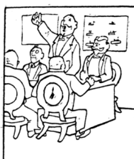
4. И только в Женеве безупречно прошла комедия разоружения.