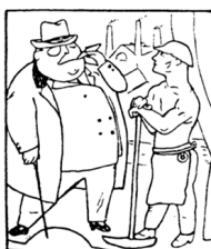
2. Берлин неожиданно увлекся социальной драмой.