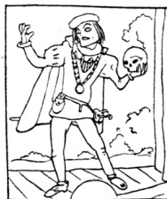
1. Лондон традиционно аплодировал шекспировской трагедии.