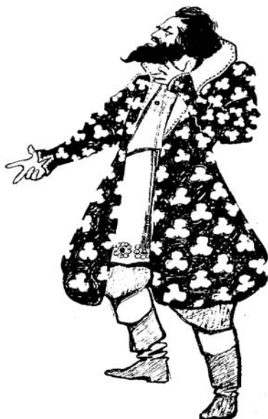
Борисъ Годуновъ. Англійскій шаржъ.

Онъ "нисколько не притязаетъ ни на исчерпывающую полноту свѣдѣній о замѣчательномъ артистѣ, ни на собственную глубину въ стрем-