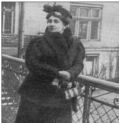
М.К. Заньковецкая. Одесса. 1915 г.

Значитъ, украинскій театръ не есть нѣчто отмирающее. Конечно, гнетъ, который лежалъ на украинскомъ театрѣ до недавняго времени, дать себя чувствовать. И ему, этому гнету, принадлежитъ не-