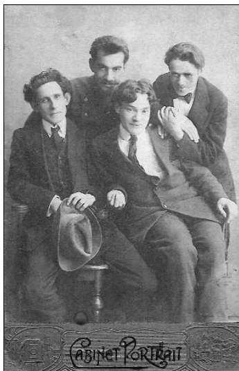
"Свободная мастерская" Малик, Нюренберг, Юхневич, Мидлер Одесса, 1916 г.

в коллекции Перемена, который систематически приобретал работы "независимых".