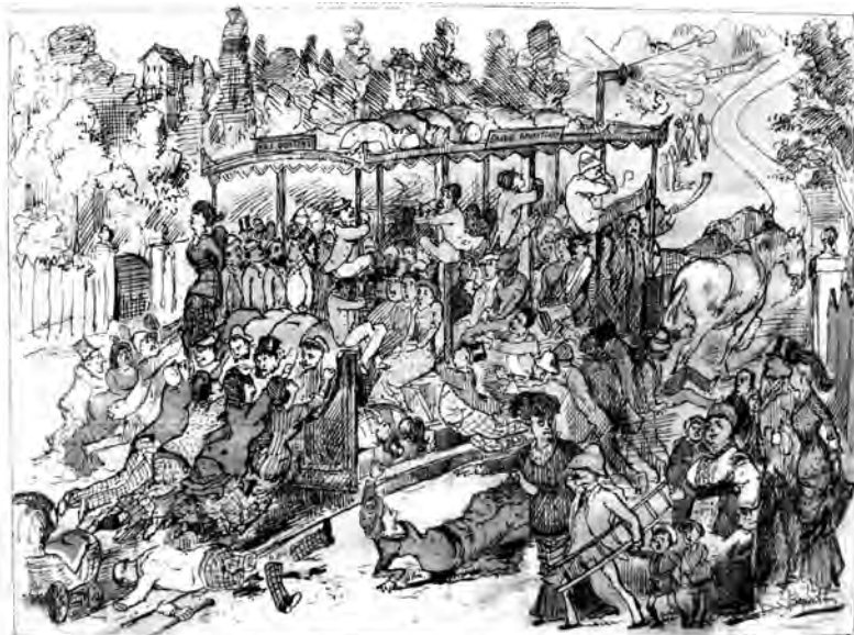
Картинки Одесской жизни. Возвращение съ Фонтана