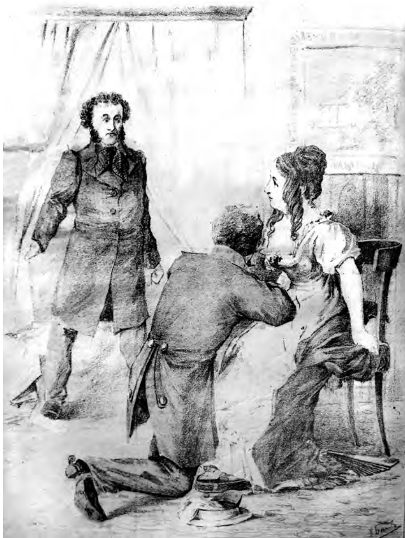
Пушкинь заставшій Дантеса на колняхъ передъ Наталіей Николаевной Пушкиной