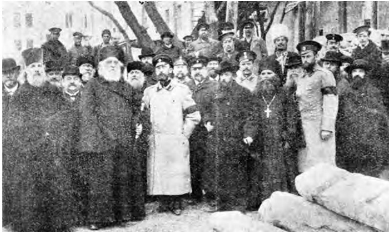
На торжестве освящения и поднятия креста на главный купол церкви при епархиальном доме

Освящение креста и водружение его на главный купол состоялось 8 марта 1909 года при большом стечении народа. Освящение совершил высокопреосвященнейший архиепископ Дмитрий вместе с другими лицами одесского духовенства. Пел хор архиерейских певчих прямо на улице против главного входа со стороны улицы Жуковского.