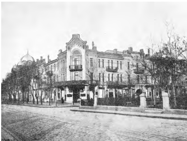
Херсоно-одесский епархиальный дом

Кроме епархиальной части здания с церковью одновременно активно проводились работы по обновлению доходной части дома, углом выходящей на улицу Жуковского и Александровский проспект. Там были оборудованы комфортабельные квартиры, предназначенные для сдачи внаем.