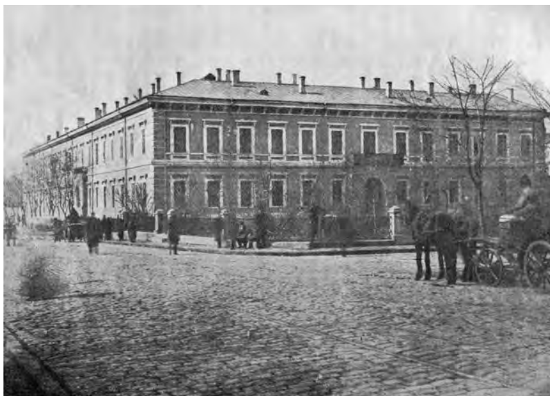
Старые здания Одесской духовной семинарии

Начнем по порядку. На углу улицы Жуковского (Почтовой) и Александровского проспекта в наемном доме с 1838 года располагалась Одесская духовная семинария, двухэтажное стандартное здание которой было вытянуто вдоль этих двух улиц. Еще