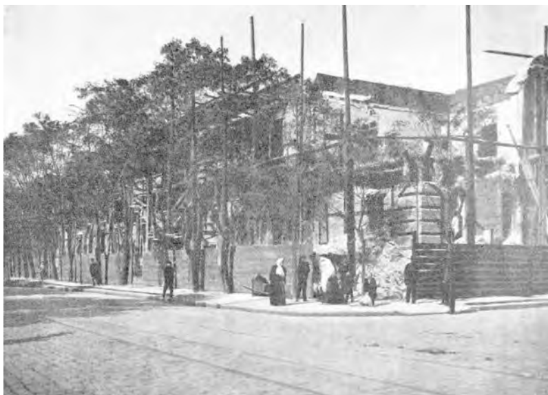
Работы по переустройству епархиального дома

Строительство началось очень активно. По планам архитекторов, во главе строящегося епархиального дома должен был