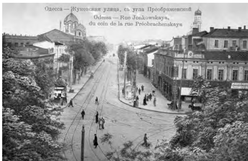
Одесса — Жуковская улица, съ угла Преображенской Odessa — Rue Jonkowskaya, du coin de la rue Préobrachenskaya

Купола принадлежали церкви Херсоно-одесского епархиального дома, сооруженного на месте здания старой духовной