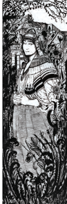
Живописные и графические работы Аристарха Кобцева погружают нас стилистикой в Серебряный век русской культуры