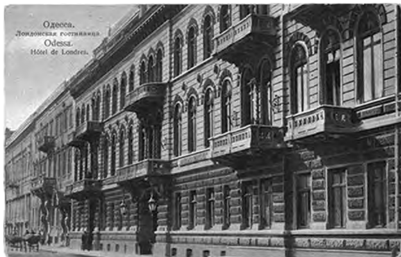
Гостиница «Лондонская». Открытка