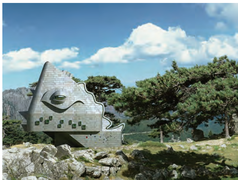
Таким будет Дом архитектора