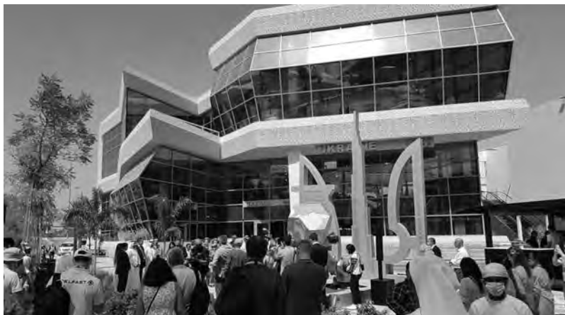
Украинский павильон на Expo 2020 Dubai

Об этом мы поговорим после, а сейчас вот о чем. Так или иначе, виртуально или реально автор и его создание уже погуляли по Одессе, Киеву, Харькову, а в минувшем году добрались и до Аравии, где стали участниками крупнейшего мирового