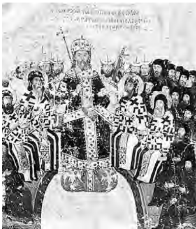
Иоанн IV Кантакузин

тью свидетельствуют, что она «опустошала как города, так и села, и наши, и все, которые последовательно простираются от Гада до столбов геркулесовых» (историк Никифор Григора), и прошла «вокруг почти по всему свету» (император Иоанн IV Кантакузин).**