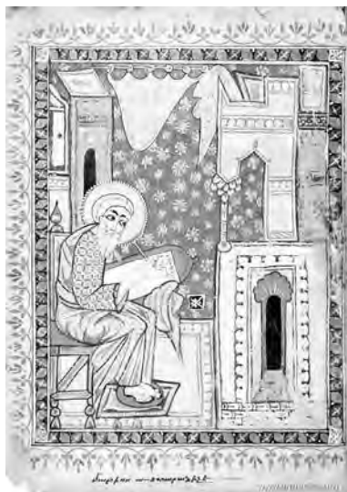
Некий армянский писец XIV века