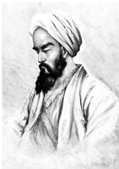
Абу Бакр Мухаммад ар-Рази

Но и о ней в причерноморских степях никакими конкретными сведениями мы не располагаем. Лишь самые общие соображения позволяют думать, что она могла охватить пограничные со степью лесостепные и лесные области, и их уцелевшие жители бежали в степь. Значит, она должна была хоть как-то отразиться и на владениях улусбека Хаджибея, поскольку чумной мор на сопредельных северных территориях был едва ли не повальным. Этот мор и опустошил Смоленск, Киев, Чернигов, Суздаль. В Глухове, согласно летописи, не осталось ни единого выжившего. Все, кто исхитрился уцелеть, бежали на юг, в степь. А бежать нужно было «дальше, дольше, быстрее» – персидский врач Абу Бакр Мухаммад ар-Рази только лишь в бегстве видел единственное спасение. Такие беженцы, несомненно, пополняли Хаджибееву «тьму» – Ябу-городок.