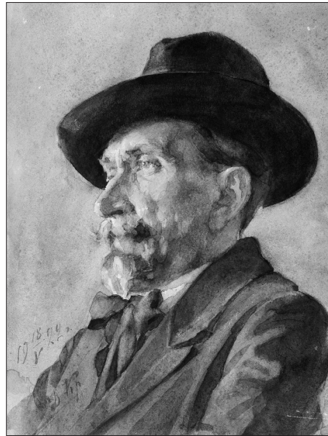
Д. Крайнев. Портрет художника Т.Я. Дворникова. Акварель. 1922 г.

12 См.: Третя відчитна художня виставка ПОМ: [каталог]. — [Одеса, 1927]. — Тираж 300 пр. — "Кімната № 6. Поліграфічна майстерня проф. В.Х. Заузе та М.І. Жука. [...] Сурков. Студент] 2 курсу — 27 — 29 [№ по кат.] літографії, 30 плакат, 31 — 32 портрет, 33 — 45 шкільні [эскизы, наброски]; Каталог третьої всеукраїнської художньої виставки НКО УСРР. — Харків, 1930 — 1931. — С. 30, 48; in. 2; Виставки советского изобразительного искусства: справочник. В 5 т. — М., 1965 — 1981. — Т. 1. — 1965. — С. 358, 371, 529; Т. 2. — 1967. — С. 406, 547.