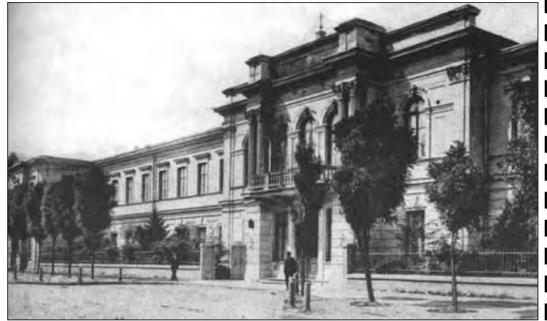
Старoportofrankovская, 26. Здание 2-й мужской гимназии — первое здание ИНО

С начала 1920 г. Наркомобразование Украины развернул широкую деятельность по перестройке новой средней и высшей школы, улучшению подготовки специалистов. 24 февраля 1920 г. была разработана новая "Временная инструкция губернским отделам народного образования", в которой речь шла о введении ряда изменений в организацию деятельности высшей школы. Ею предусматривалось образование в Украине институтов народного образования. Постановление от 3 мая 1920 г. о приеме в вузы дальше конкретизировало положение основного документа.