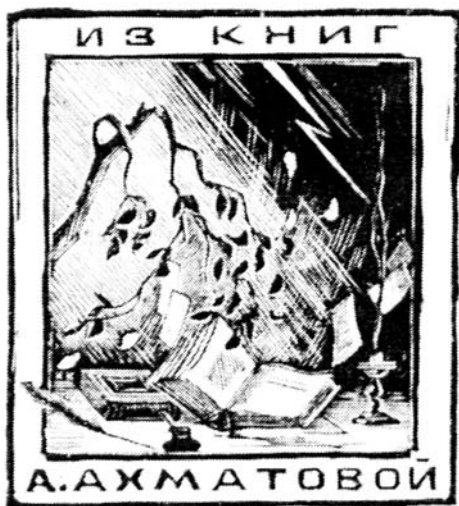
К.С. Козловский, 1969 г.