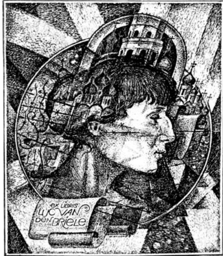
В.Е. Верещагин, 1990 г.