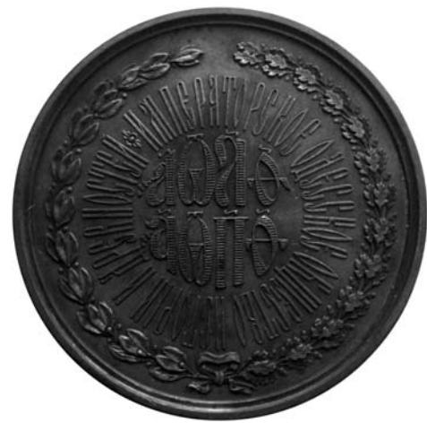
Юбилейная медаль в память 50-летия Императорского Одесского общества истории и древностей — экземпляр Одесского археологического музея Национальной Академии наук Украины, бронза, диаметр 46,5 мм, вес 53,63 г.