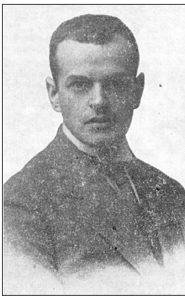
1911 г. Л.Н. Юровский корреспондент "Русских ведомостей"

13.12.1904 г.) после окончания Московского университета в 1859 г. работал в Одессе, Харькове. С 1870 г. — профессор Киевского университета, с 1871 г. — петербургской Медико-хирургической академии, с 1880 г. — Московского университета. В 1893-1900 гг. — директор клинического института усовершенствования врачей в Петербурге. Один из пионеров брюшной хирургии, антисептики и асептики в России, автор многих научных трудов. Умер в селе Яковцы (ныне в пределах Полтавы).