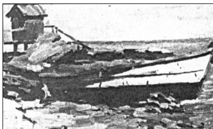
К.К. Ксида. "Пейзаж с лодкой" Фонд В. Кандинского. Париж

Обратимся теперь к фрагментам писем Кандинского, адресованных Г. Мюнтер, в которых он упоминает о своих занятиях живописью в Одессе.