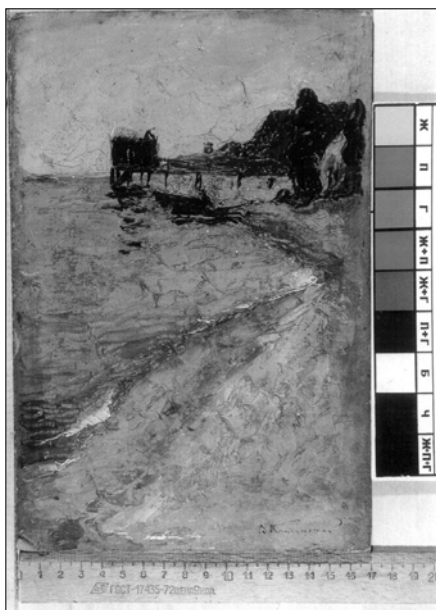
Этюд "Купальня". Частное собрание. Украина

В 2000 г. в поле внимания Одесского художественного музея оказался небольшой этюд с изображением морского побережья и купальни. Основа — картон; техника — масло; размеры 27х17 см. На лицевой стороне справа внизу сигнатура — В. Кандинский .