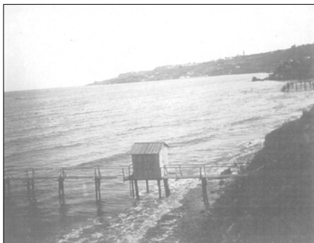
Анонимный автор (Кандинский?) Фотография 13-й станции. Вид с высокого берега

коллекцию произведений одесских художников — Г. Головкова, П. Нилуса, Е. Петрокино 6 . В Одессе у К. Ксида была мастерская — сохранились фотографии ее интерьера, с палитрой и картиной на стене. На этих фотографиях сняты Лиза Ксида, отец В. Кандинского и др. лица 7 .