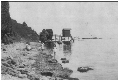
Почтовая открытка с изображением купальни на 13-й ст. Фонтана. Слева два больших камня, которые видны и на этюде "Купальня".

Перед нами натуральный пейзажный мотив с изображением уходящей от переднего плана по перспективе вглубь и вправо, а затем резко влево ломаной линии морского берега. На среднем плане обобщенно решенное изображение свайного строения — купальни —