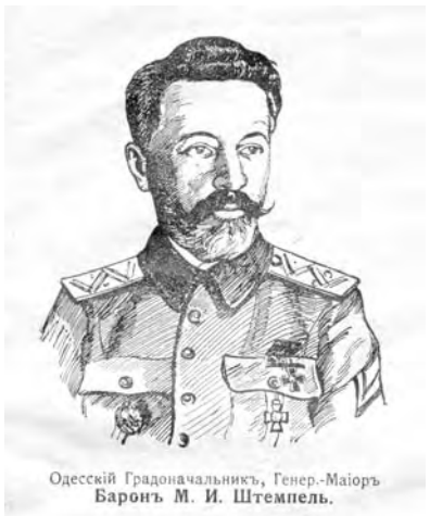
Одесскій Градоначальникъ, Генер.-Маіоръ Баронъ М. И. Штемпель.

Считай, высчитывай! Если грошь пропасть – упрямо ищи, – Нужен каждый грошь при постройкѣ – Бухгалтерь, гляди остро!.. Всѣ возвращайтесь! Завтра въ плаваніе!