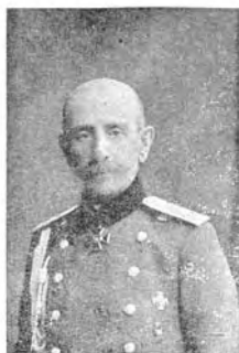
Ген. М. И. Зѣбровъ.