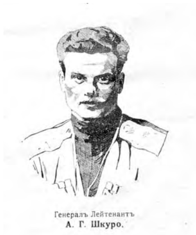
Генераль Лейтенантъ А. Г. Шкуро.

Завтра въ плаваніе! Помолимся на пристани въ шумной гавани, Николаю Чудотворцу – Слава, Онъ пошлетъ кораблямъ счастье, Священникъ, окропи снасть!.. Валентинъ Горяскій.