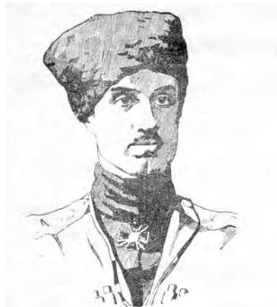
Генераль-Лейтенантъ Баронъ П. Н. Врангель.