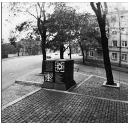
Памятный знак в Прохоровском сквере

минуемо влечет за собой уголовную ответственность. Зато уничтожение охраняемых законом исторических кварталов, варварское выламывание старинных решеток (кстати, отнюдь не лишенных материальной ценности) остается безнаказанным. Никому из нас еще не приходило в голову, что Союз художников или архитекторов давно могли бы (и не раз, и не два) подать в суд на ведомственные организации, включая, естественно, и ГлавАПУ, занимавшееся на территории Одессы самым элементарным членовредительством. Почему же не приходило? Отчего мы не сделали этого до сих пор? Может быть, потому что каждый из рискованных шагов этих ведомственных организаций, представляющих собой, как иногда кажется, чуть ли не государство в государстве, настолько равнодушны они к критическим замечаниям в свой адрес, потому что каждый поступок свой тайно, чтобы не успело возмутиться общественное мнение, обставляется бесконечным числом словесных обоснований, тоннами проектной документации. За этим бумажным бруствером они неуязвимы или кажутся себе неуязвимыми, это уж как посмотреть. Но что такое эта документация? Давайте разберемся в этом.