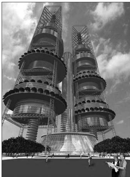
Предложения по реабилитации Всемирного торгового центра в Нью-Йорке

помощи их никто не ждет. Более того, нам ясно дают понять, что в ней нет никакой необходимости. Ответ один. Творческие союзы обязаны вмешаться в жизнь города по собственной инициативе. В том числе и в свою собственную судьбу. Отсутствие современного выставочного комплекса, служебных помещений и надлежащих творческих мастерских у выдающейся когорты одесских художников едва ли способствует сближению города и художников, творческому росту сил.