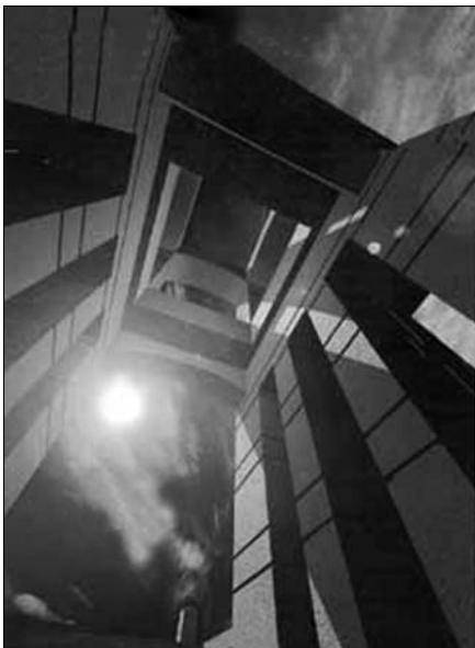
Проект мемориала по увековечению памяти жертв Холокоста "Дорога смерти"

По-разному складываются взаимоотношения художника с действительностью. Однако взаимное отчуждение друг от друга художников и города, наших творческих союзов от проблем, которые должны ими решаться, и привели нас к сегодняшнему положению вещей. Неудивительно, что поисками исчезнувших с крыш флюгеров занялся журналист, а не художники, которых этот факт должен был насторожить куда раньше. И неудивительно, что флюгеры и по сей день валяются на чердаке злополучного дома — архитектурное руководство города к газетным уколам нечувствительно. Что ж, процесс отчуждения, о котором я рассказываю, обоюден. "Средний" уровень, получивший распространение в нашем городе, заинтересован в том, чтобы не замечать попыток изменить ситуацию в лучшую сторону и, соответственно, против граждан-