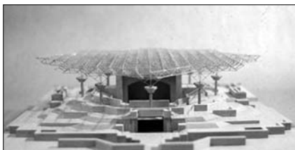
Проект летнего театра Филармонии в Городском саду

ныне в филиалы городской свалки, до зияющих неосмысленной пустотой полупустырей между новостройками жилмассива Котовского.