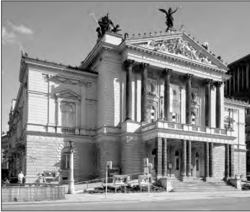
Национальный театр Чехословакии