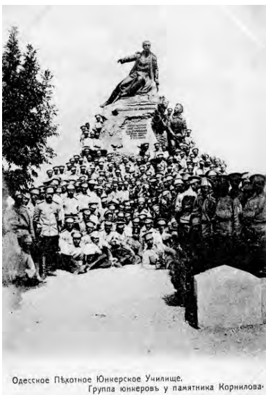
Одесское Пехотное Юнкерское Училище. Группа юнкеров у памятника Корнилова.