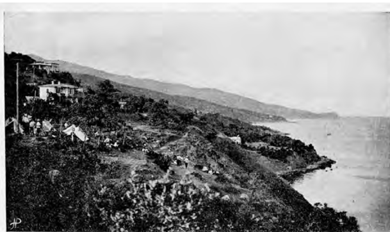
Одесск. Пѣх. Юнкерск. Уч.