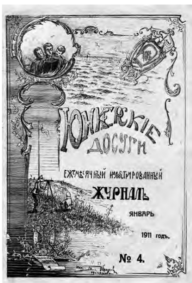
Журнал «Юнкерские досуги»

ресок, размещенных в ученическом издании. Можно смело утверждать, что училище выпускало отнюдь не тупых солдафонов, а достойных, образованных и развитых офицеров русской армии.