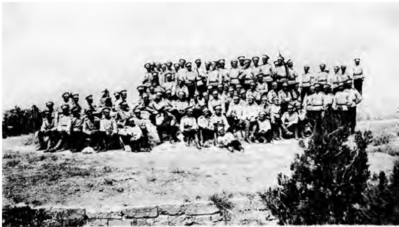
Одесское Пехотное Юнкерское Училище. Группа юнкеров на Малаховом кургане.