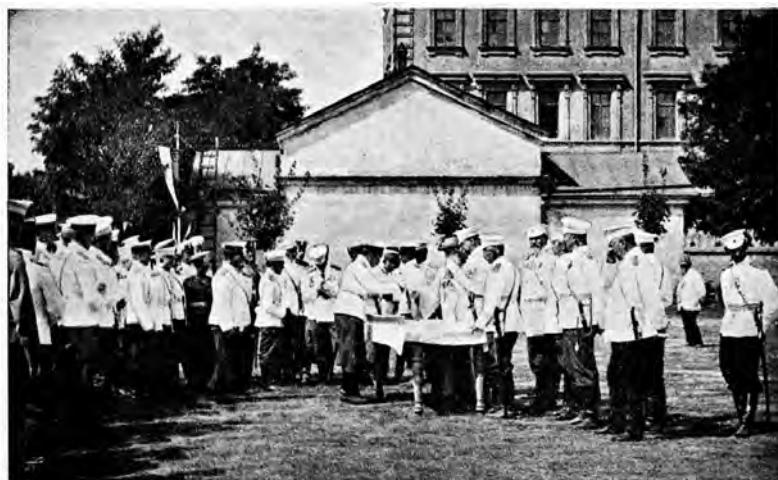
Одесск. Пѣх. Юнкерск. Уч.

Очень эффективным видом практической подготовки будущих офицеров были маневры. Летом 1907 года юнкера были отправлены на маневры в Крым, причем с ними был откомандирован фотограф, запечатлевший некоторые моменты полевых занятий юнкеров и посещение ими достопримечательностей Крыма. Открытки по выполненным негативам были отпечатаны также в графическом заведении А. Новака и К. Побуды.