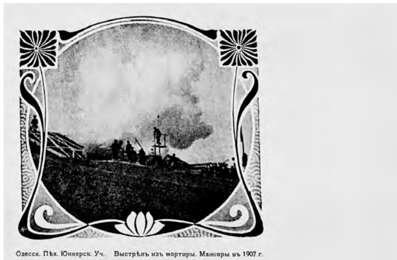
Одесск. Пех. Юнкерск. Уч. Выстрѣлъ изъ мортиры. Маневры въ 1907 г.