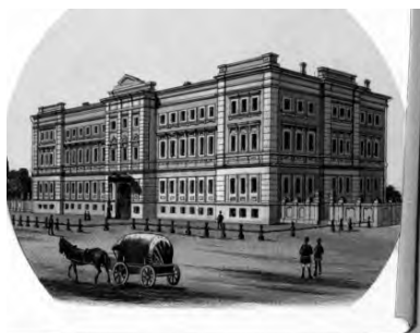
Юнкерское училище. Литография

из лучших типографских заведений Европы – «Фабрике бумаги в Берлине».