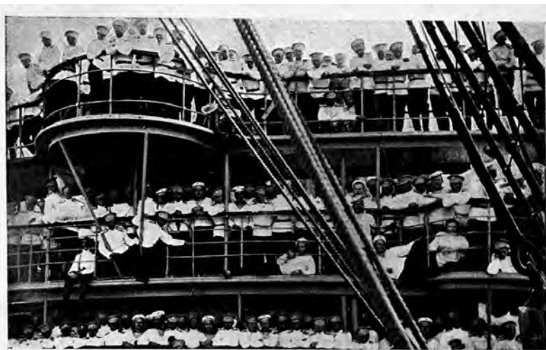
Одесск. Пѣх. Юнкерск. Уч.