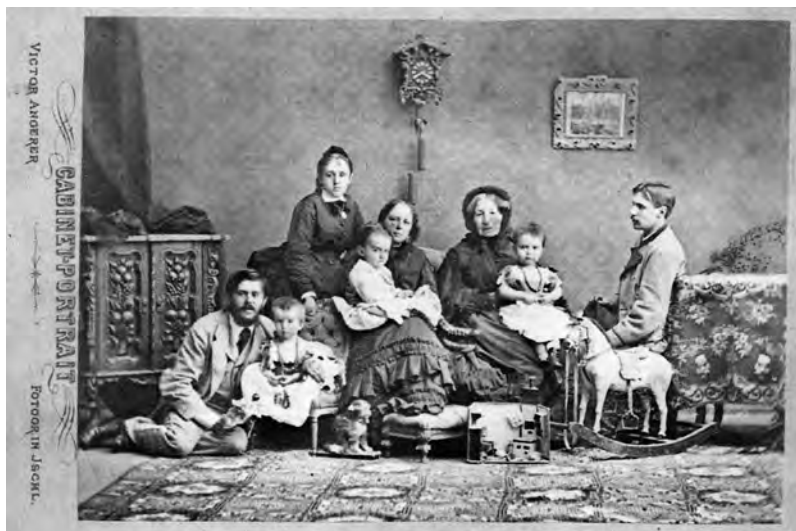
Групповая фотография Воронцовых (ок. 1873 г.)

например, мой большой портрет и портрет отца моего из Индийского кабинета; портрет императрицы Екатерины из Зеленой гостиной и портрет короля шведского из бильярдной и из Большой гостиной; по самой крайней мере, – прекрасную картину Тициана («Богородица с младенцем, святым Иосифом и св. Екатериной») и картину Рафаэля («Богородица с младенцем»); но, ежели возможно, то мы желали спасти все эти отличные картины из Большой гостиной.