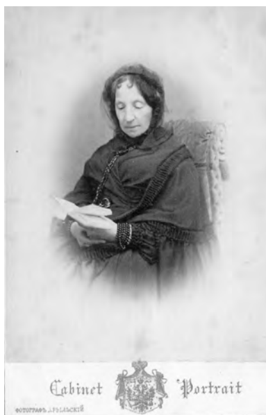
Елизавета Ксаверьевна Воронцова (1792-1880) Фото из «лондонского архива»

Хоть клад не нашел, но увидел его. И не только увидел – ощутил. И оценил. Хотя, как я понимаю, физически, в материальном отношении, его оценить невозможно. Здесь все, как положено: огромный железный с крышкой на петлях и с замком сундук. А содержимое... Прямо как в том петербургском кладе, приблизительно