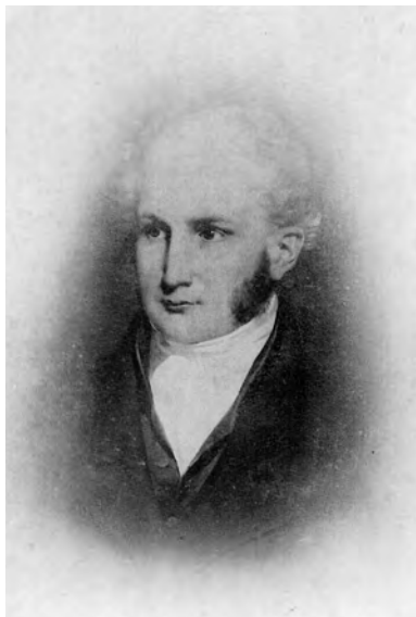
Уильям Праут (1785-1850)

Отдельная пачка архива связана с именем видного английского ученого-химика первой половины XIX века Уильяма Праута,