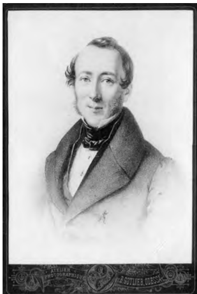
Джон Праут (1794-1841)

в работе Сиротского дома Женского новороссийского благотворительного общества.