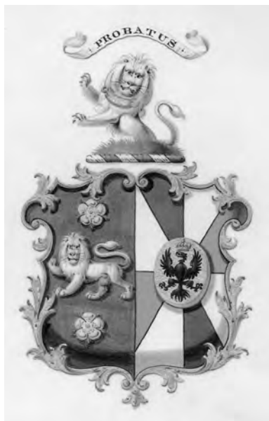
Герб Липранди-Праут Из «лондонского архива»