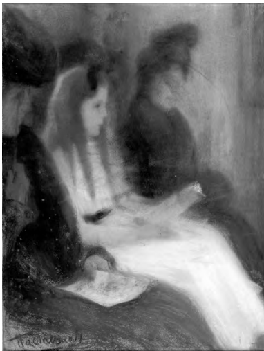
Л.О. Пастернак. «На концерте» Одесский художественный музей

Дмитриевич также приглашен и вышлет несколько своих вещей. Размарицыну непременно скажите, чтобы при продаже своих вещей поставил условием на время их отправить на выставку в Москве 36-ти обязательно.* Я напишу ему также – только я его адреса не имею и не знаю, и напишу на Ваш, а Вы, голубчик, перешлите уж ему. Ну-с, будьте здоровы, здоровы, здоровы и счастливы! Целую Вас.