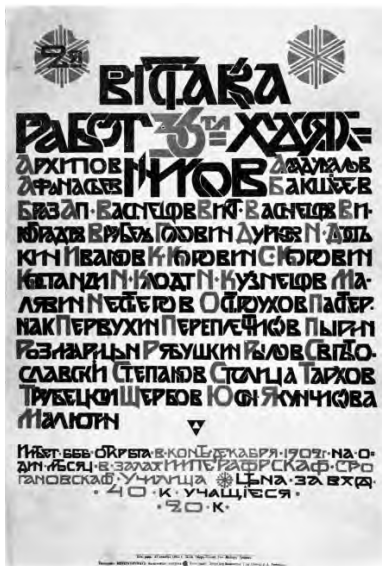
М.А. Врубель. Афиша II выставки 36-ти художников. Москва. 1902