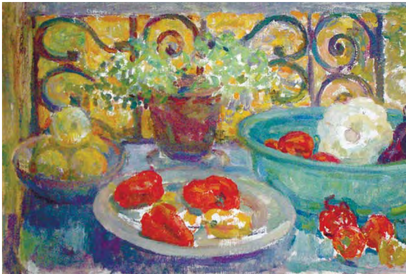
Д.М. Фрумина. Живопись