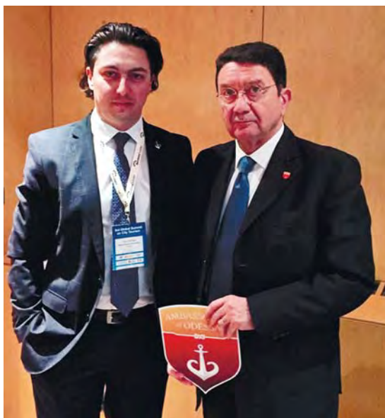
Первым амбассадором Одессы стал Генеральный секретарь Всемирной туристической организации (ЮНВТ) господин Талеб Рифаи