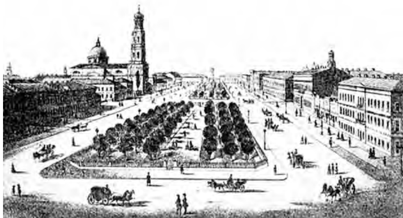
Вид на Александровский проспект и Покровскую церковь. 1869 г.