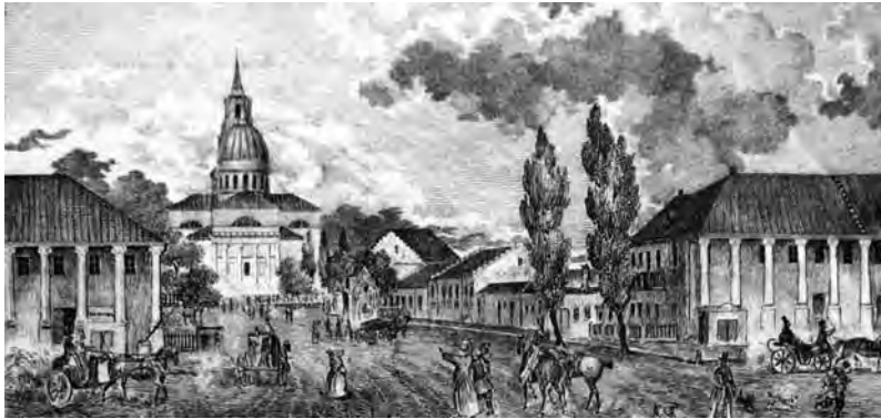
Вид на Железный и Мелочный ряды, Греческую улицу и Собор со стороны одноименной площади. 1840-е гг.

Пушкин застал уже полностью сформировавшийся на площади ансамбль всех четырех торговых отделений.