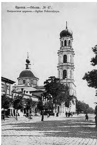
Покровская церковь. Открытка 1902 г.