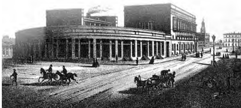
Бывший дом А.И. Маюрова на Александровской площади. 1869 г.

Следующий квартал проспекта, меж улицами Полицейской (Бунина) и Почтовой (Жуковского), хотя и был застроен разнообразными частными домами, но фактически тоже представлял собой торговый центр, поскольку в первых этажах размещались многочисленные коммерческие заведения. Глянем на некоторые. Первым слева – Александровский проспект, № 1, – был дом отставного