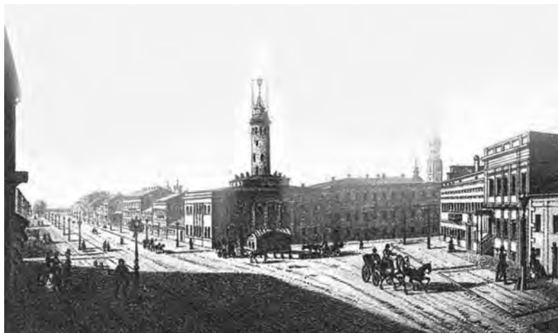
Полицейская площадь. 1869 г.

С 1816-го решался вопрос строительства капитального тюремного замка в Одессе, потребность в каковом к тому времени ощущалась уже крайне остро. В архивном фонде Одесского строительного