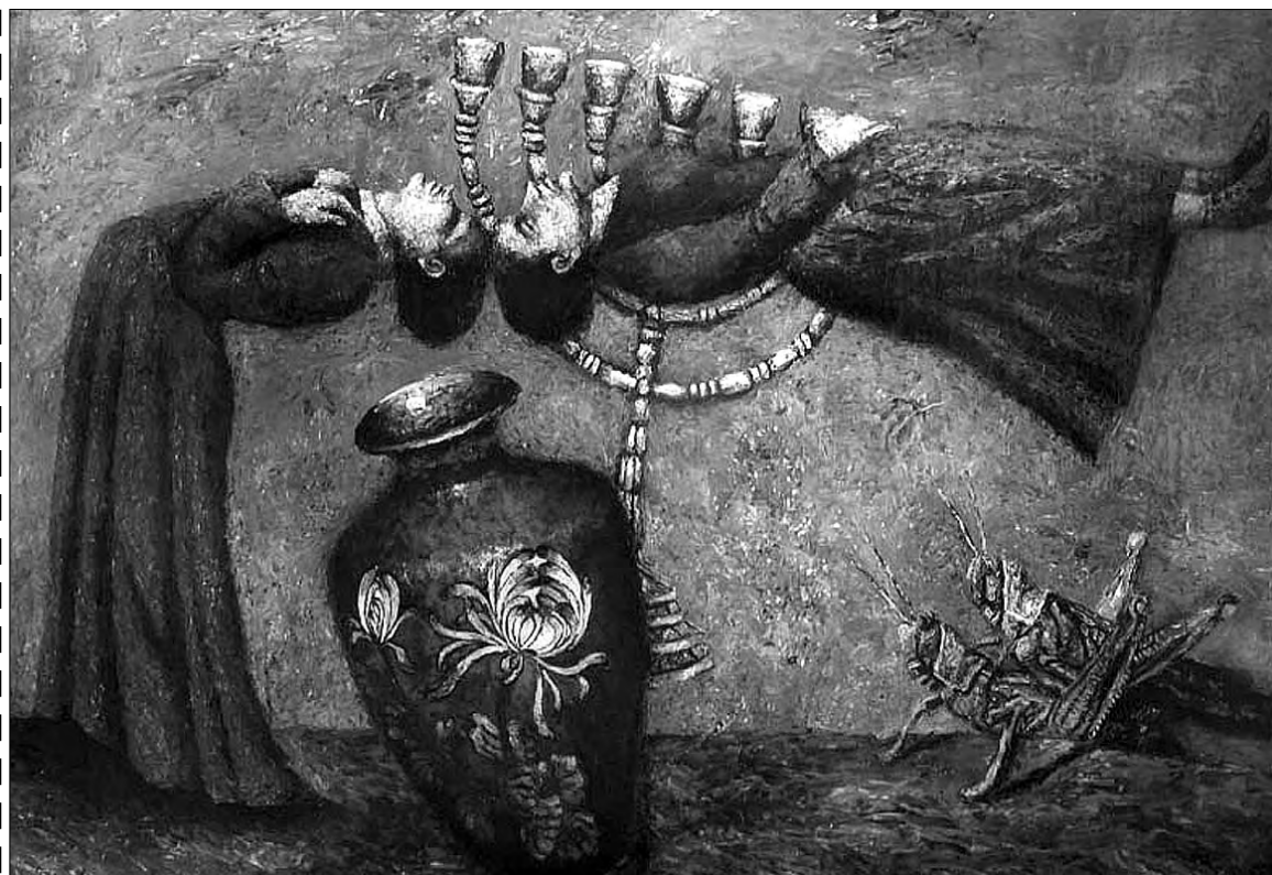
Бал в Фоли-Бержер. 2008 г.

Александр Ройтбурд признан как один из наиболее значительных художников Украины конца XX — начала XXI столетия. Хотел по привычке написать "художников Одессы", но уже не могу.