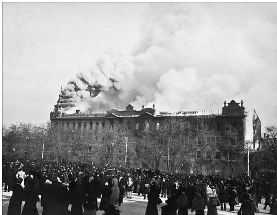
Пожар в "Пассаже", в результате которого здание лишилось башенки, фото 1901 года.