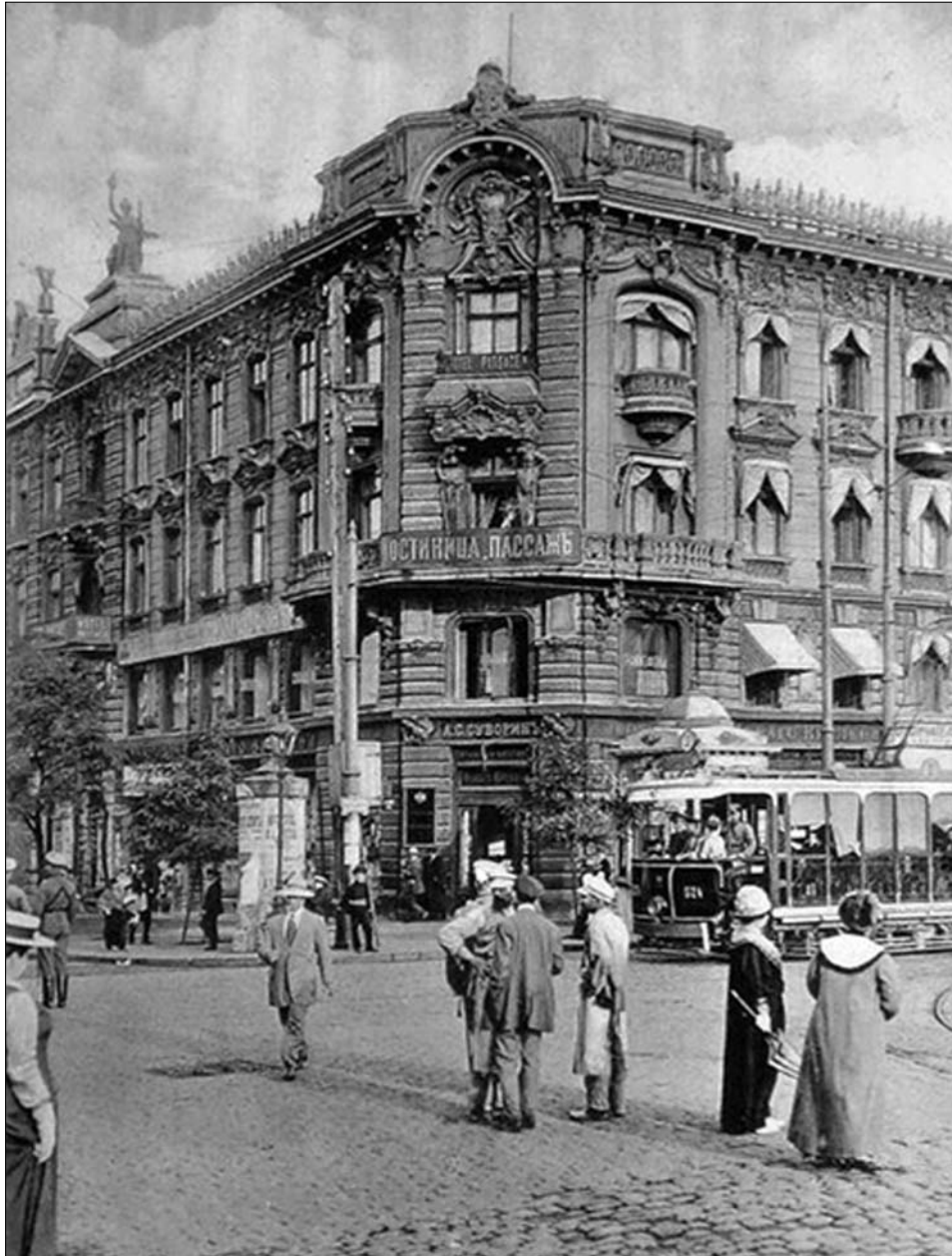
Преображенская, гостиница "Пассаж", фото 1910-х годов.