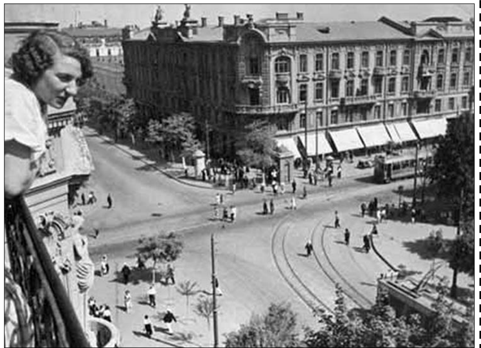
Фотография 1939 года.