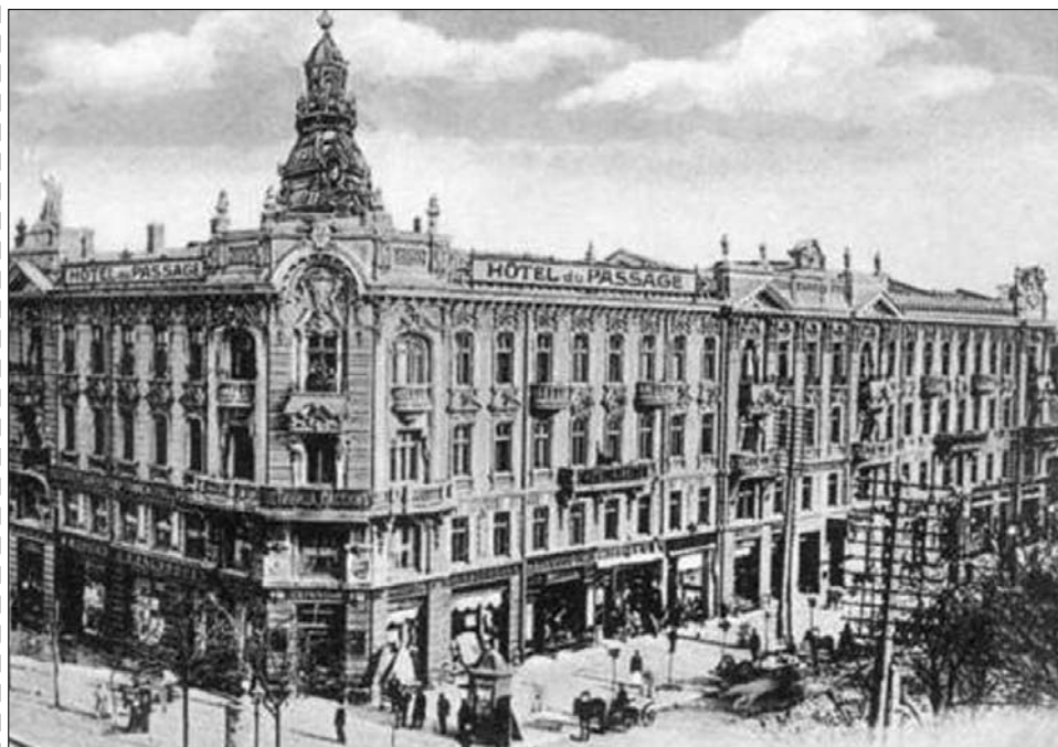
Преображенская угол Дерибасовской, здание гостиницы "Пассаж", фото 1900 года.