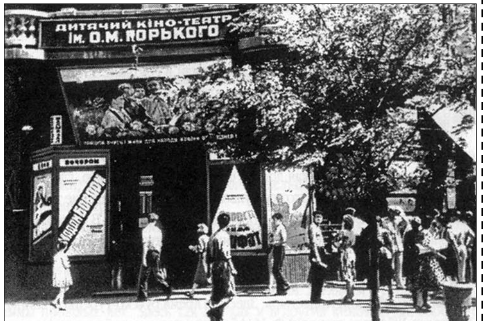
Ул. X-летия Красной Армии, кинотеатр им. Горького, фото 1950-х годов.