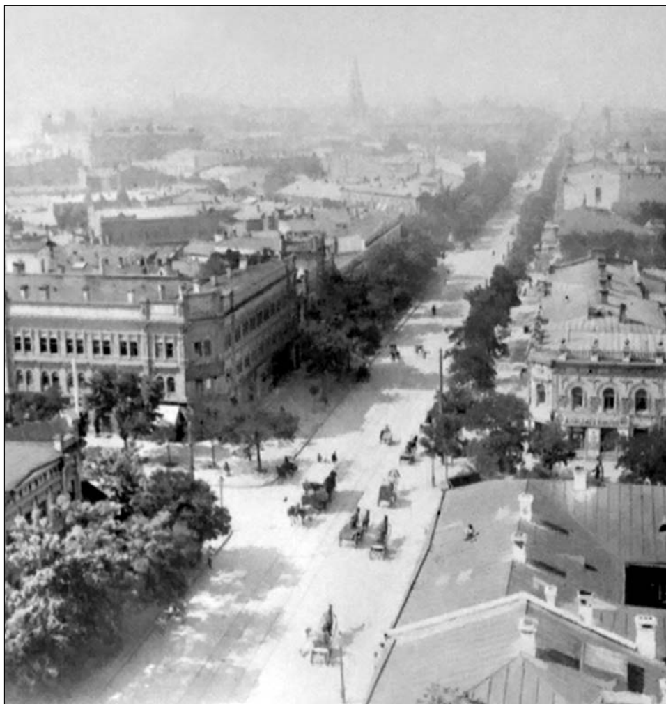
Улица Преображенская, вид с колокольни Успенского собора.