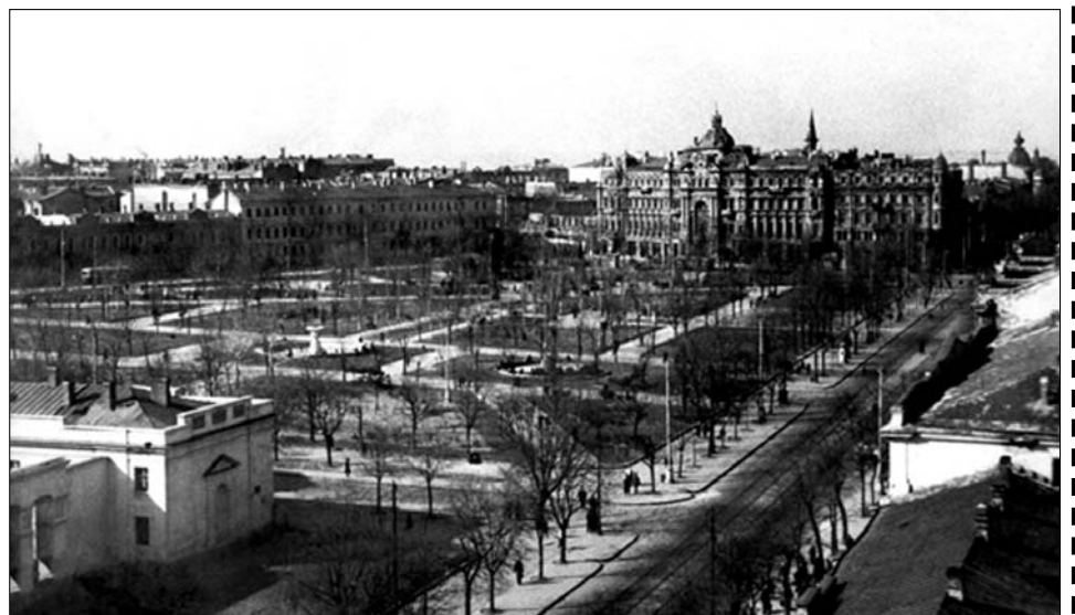
Ул. X-летия Красной Армии и площадь Советской Армии, фото конца 1940-х годов.