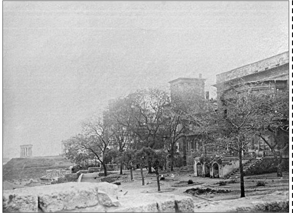
Бульвар в начале ул. Троцкого, теперешний бульвар Жванецкого, фотография 1920-х годов.