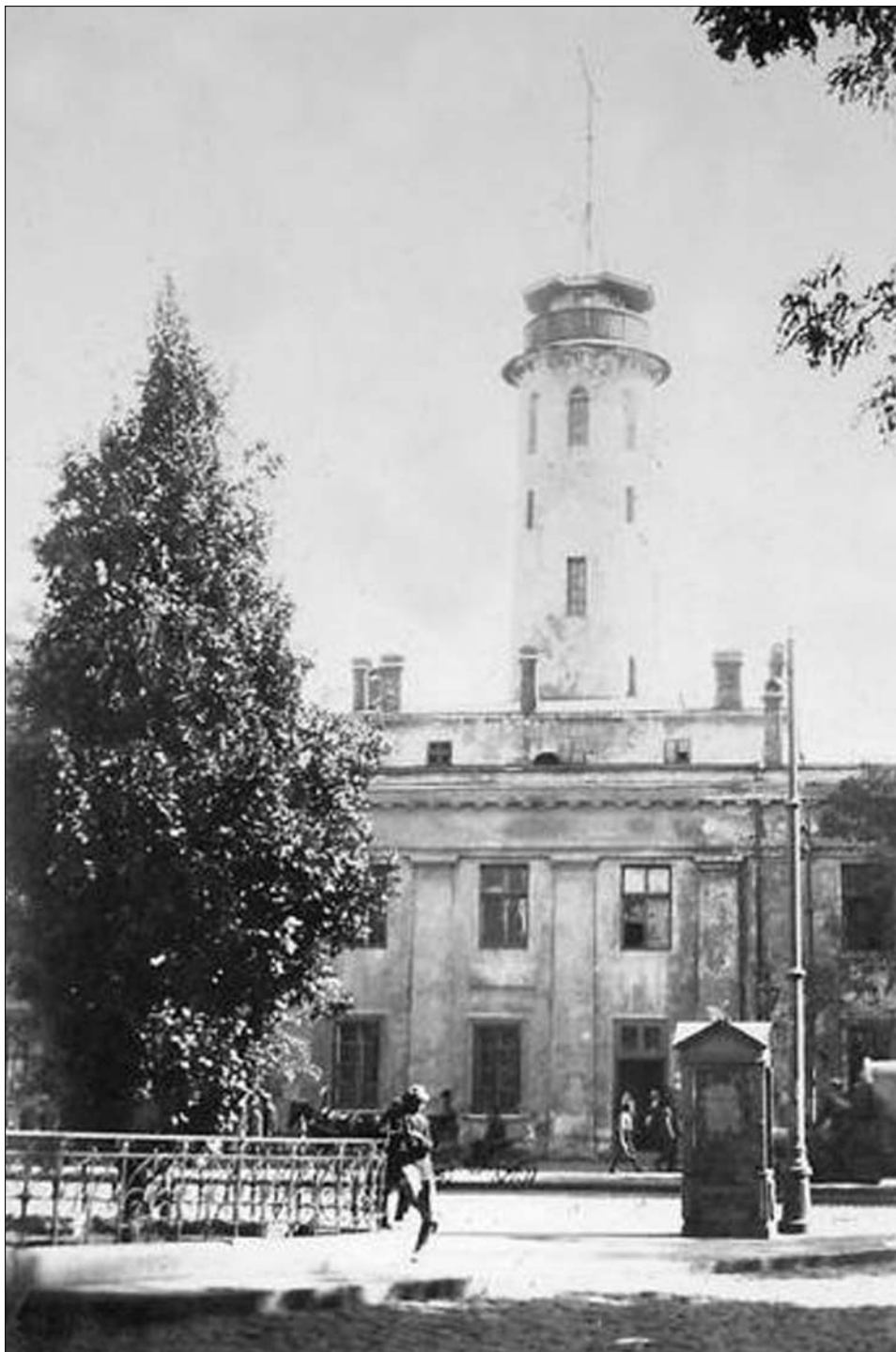
Вид на ул. Преображенскую, на каланчу Бульварного полицейского участка, фото 1917 года.