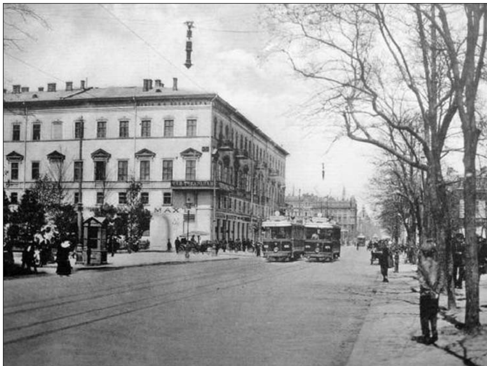
Преображенская, дом Папудова, фото 1910-х годов.