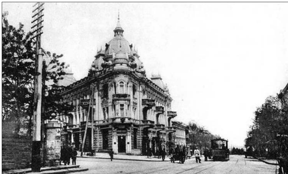
Преображенская угол Елизаветинской, 1901 год.