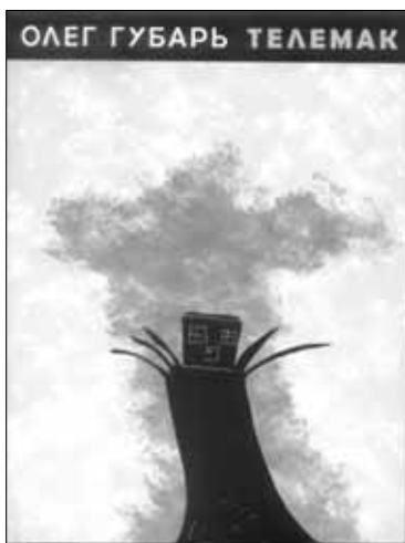
Олег ГУБАРЬ. "Телемак: Легенда о Круглом доме" Книга иллюстрирована рисунками Федора Олеговича Губаря Автор уточняет: это графика 3-6-летнего ребенка. Одесса. Печатный дом. 2005