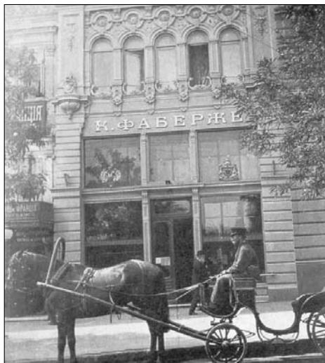
Магазин фирмы Фаберже в Одессе Начало 1900-х гг.