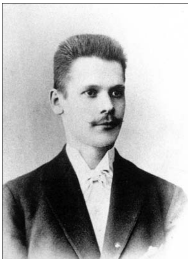
Карл Густав Хьялмар Амфельдт

зависимо привлечения виновных к судебной ответственности, фабрика немедленно будет закрыта по распоряжению администрации" [15].