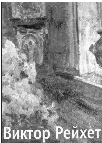
"Виктор Рейхет". Альбом Статья М. Германа Санкт-Петербург, 2006

послужит пособием тем, кто заинтересуется, была ли интеллигенция в Одессе в 60-70-е годы XX века.