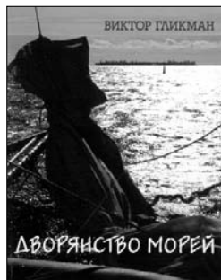
Виктор ГЛИКМАН Дворянство морей Одесса, "Зодиак", 2007

Думаю, с появлением таких книг хорошего действительно становится больше. И это помогает людям жить в трудные, не самые хорошие времена.