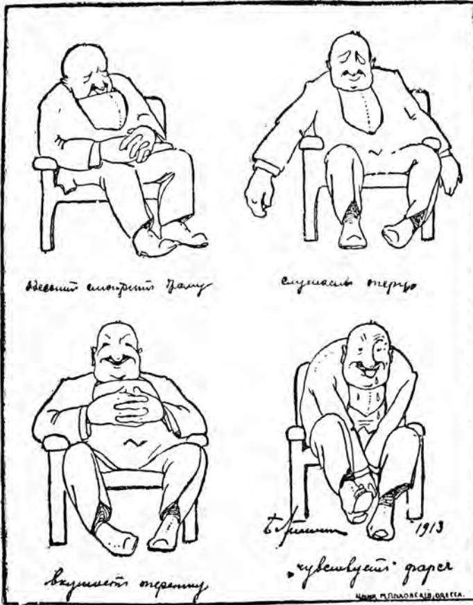
Рис. Б. Антоновскаго.