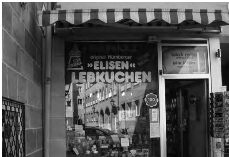
Здесь можно купить и тут же съесть дивные пряники, название которых в переводе с немецкого означает «пирожные жизни»

Несмотря на имперское прошлое и многовековую историю, Нюрнберг сегодня ближе к провинции, чем к современному