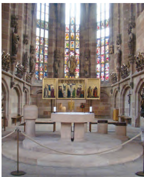
Алтарь и витражи собора