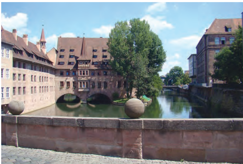
В летний день здесь прохладно и тихо...