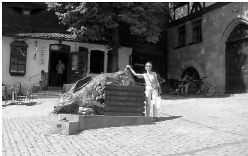
Будем надеяться, что его уши принесут удачу...