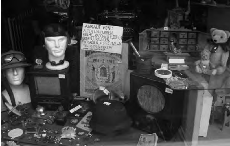
В витрине антиквара соседствуют каски времен второй мировой войны и ретро-гаджеты

полису. Его крепостные стены, помнящие столь многое, как бы огораживают его от нас и нас от него. Может быть, это и к лучшему.