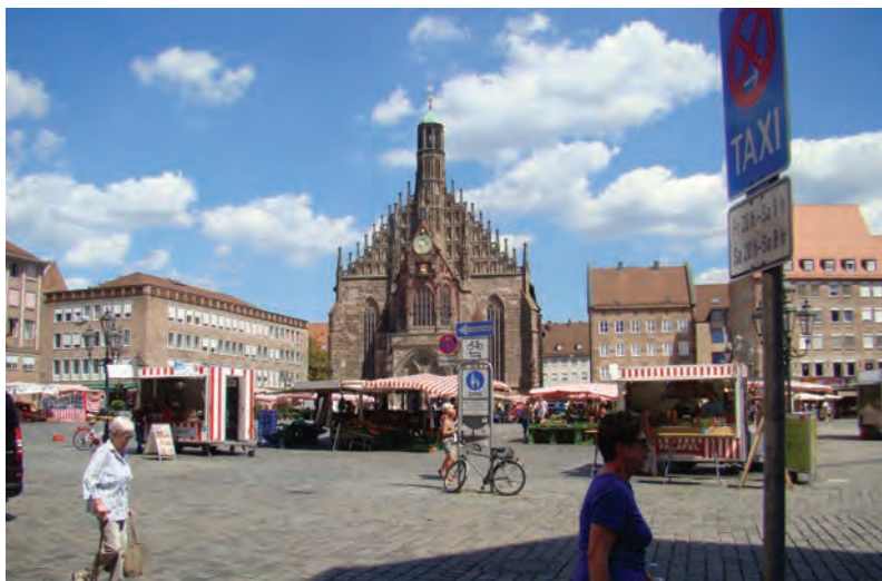
Главный и самый знаменитый собор Нюрнберга – Фрауэнкирхе