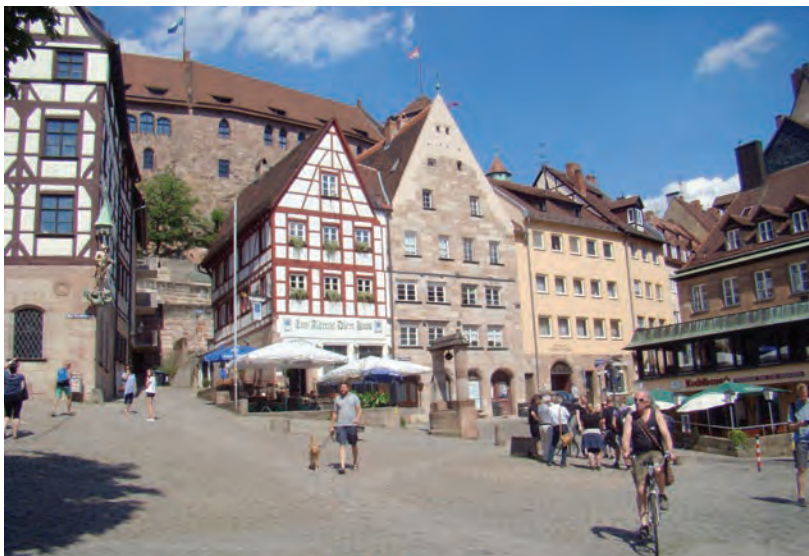
У дома Альбрехта Дюрера