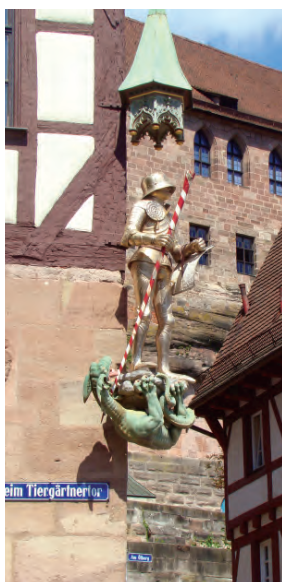
Жил на свете рыцарь...