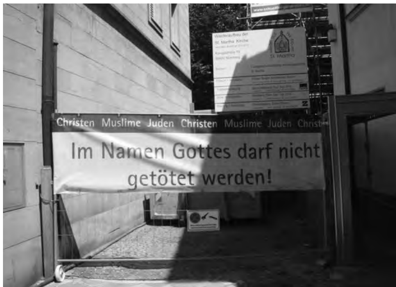
Призыв от имени Бога «Не убивать никого!» звучит в Нюрнберге с особым смыслом

Современная чугунная композиция, созданная спустя 501 год (2003), – плод фантазии скульптора Юргена Герца. Массивная