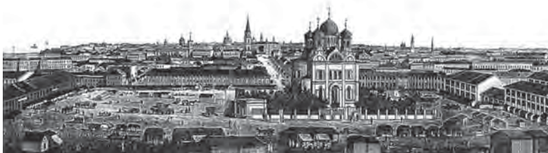
Площадь Нового рынка в 1860-х

кающие к торговым корпусам со стороны переулков. В архивных делах иного рода находим оценочную стоимость таких строений – по тем временам весьма значительную.