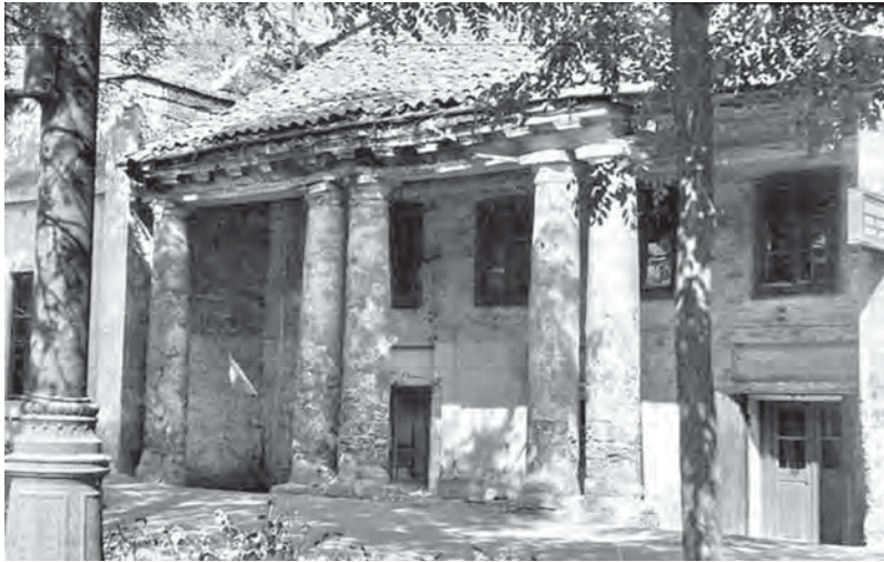
Лавки в Старом рыбном ряду. 1960-е гг.

Илье Ичаджику – № 3, мещанину Николаю Павлову – № 4, мещанину Димитрию Панченко – № 5, купцу Димитрию Калафати – № 6, мещанину Ивану Керексили (?) № 7, купцу Ивану Биби – № 8, мещанину Максиму Могилевскому – № 9, мещанину Илье Базарному – № 10, мещанину Ивану Барабашеву – № 11, купцу Ивану Дичопуро (Дичопуло?) – № 12, мещанину Якову Цурину – № 13, мещанину Леонтию Тимченко – № 14, купцу Григорию Немешеву – № 15, мещанину Якову Арсентьеву – № 16, мещанину Якову Доброве – № 17, мещанину Федору Кулибину – № 18, мещанину Даниле Колошину – № 19.