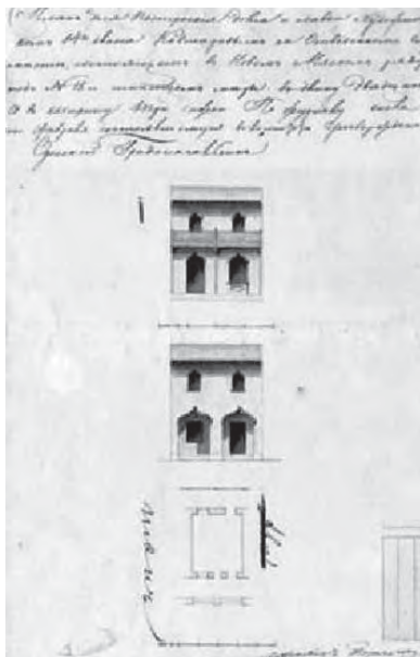
Стандартная секция Нового Мясного ряда: двухэтажный дом с лавкой И.И. Ковшарова. Архитектор Джордж Торичелли

Из плана Е.Х. Ферстера 1802 г. видно, что мясные ряды занимают нечетную сторону Большой Арнаутской улицы в пределах двух кварталов – XLVII и XLVIII. Первый из них ограничен будущими улицами Преображенской, Малой Арнаутской и Александровским проспектом, второй – Александровским проспектом, Малой Арнаутской и Екатерининской. В интервале между 1798-м и 1802-м мясной ряд продолжен по четной стороне Александровского проспекта в XLVII квартале и слегка изогнулся клюшкой на противоположной его стороне. Кроме того, как и планировалось, отдельные лавки и жилые здания фиксируются в глубине обоих кварталов. В перспекти-