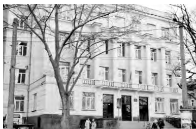
Средняя школа № 121