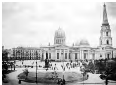
Спасо-Преображенский собор (1808-1936)

у памятника М.С. Воронцову, когда состоялось новое, уже самостоятельное путешествие. Музыкальная атмосфера дома спровоцировала в пятилетнем возрасте идею навестить старейшую музыкальную школу № 2 им. А.К. Глазунова, находящуюся в двух кварталах. Любопытно, что тогда попал в руки самого директо-