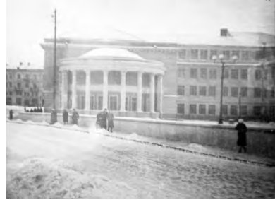
Школа Столярского. 1940 г.

Плотность школьных помещений на верхнем этаже, да и размещение нашего класса, где совмещались и занятия, и вся концертная жизнь прославленной школы, куда приезжали знаменитые музыканты-педагоги (в частности, Г.Г. Нейгауз), вызывающе контрастировали с довоенным зданием на Саба-неевом мосту, порождая массу трудностей учебного процесса.