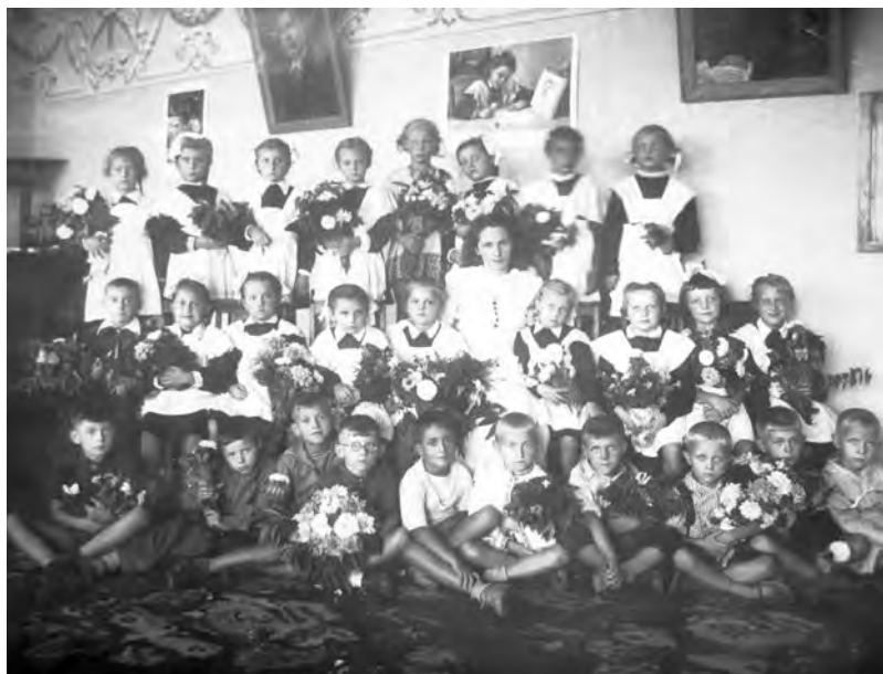
Первоклашки 1952 г.

Но коль уже был упомянут Спасо-Преображенский собор, то на его месте в то время был сооружен памятник сидящему в кресле Сталину, вззирающему на ландшафтно смоделированный украинский «план ГОЭЛРО»: текущие реки и модели гидроэлектростанций с мигающими огоньками. Эта пропагандистская инсталляция просуществовала не более месяца, развлекая малолеток, а памятник тирану – не долее пары лет после его смерти.