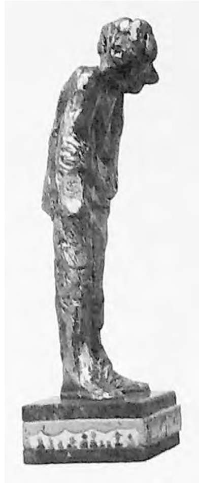
А. Володин. Рисунок и скульптура Р. Габриадзе

известных людей театра, кино, литературы, с которыми он работал и дружил. Вторая книга, кстати, оформлена рисунками Резо Габриадзе. В одном из интервью Володин сказал: «Все, что я делал в жизни, – я писал про земное, но обязательно с внутренним ощу-