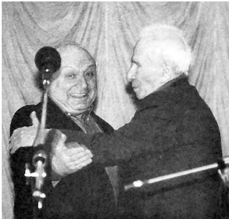
Эта фотография сделана в Концертном зале у Финляндского вокзала на презентации книжки А. Володина «Попытка покаяния», где М. Жванецкий произнес этот текст

Всю жизнь думаешь, как это все собрать, в конце мучаешься, как это все раздарить.