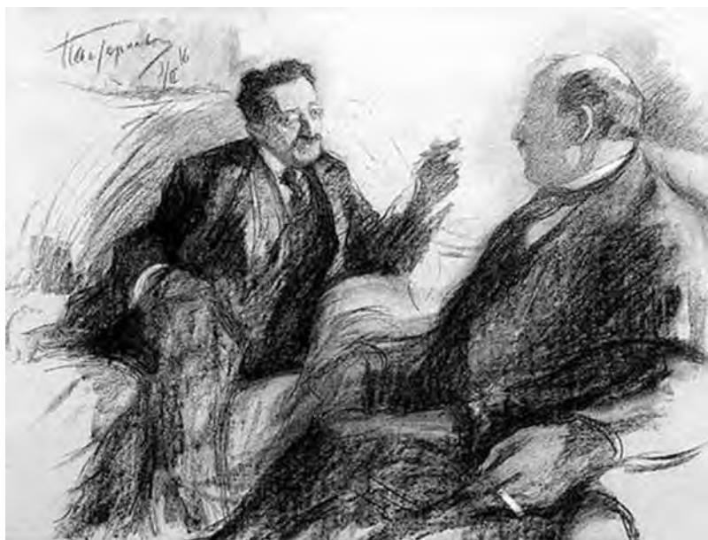
Давид Фришман и Хаим Бялик. Рисунок Леонида Пастернака. 1916 г.

В письме инспектору училища князю Львову художник поясняет: «...я поспешил выразить свою искреннюю радость и благодарность за лестное предложение. Вместе с тем я указал, что