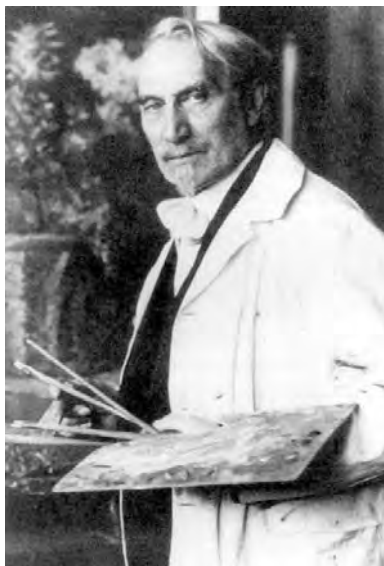
Леонид Пастернак в мастерской. Фото

Леонид Пастернак – автор портретов выдающихся людей: Ф. Шаляпина, Э. Верхарна, К. Бальмонта, А. Эйнштейна,