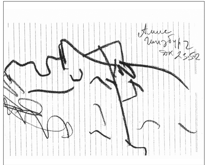
Рисунки Николая Дронникова, Париж.