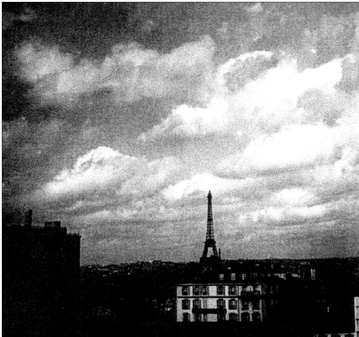
Эйфелева башня. 1930-е гг.