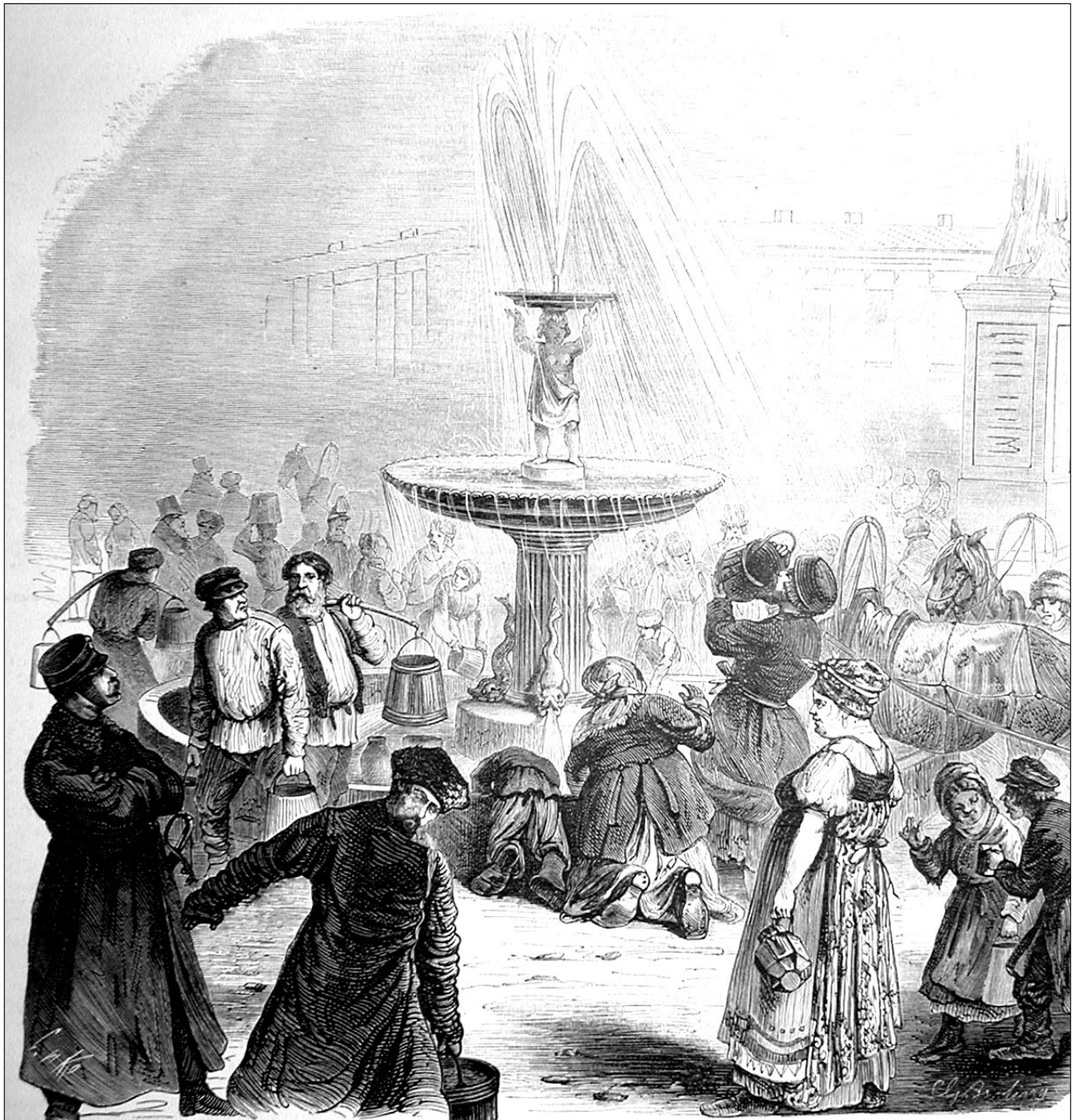
Открытие нового водопровода. Фонтан на Соборной площади. Рис. Г. Бролинг, грав. Л. Серяков