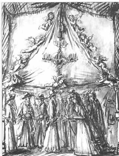
Эскиз мизансцены к пьесе Э. Шнеера (Окуня) "Фрейлехс", 1945 год Художник А. Тышлер