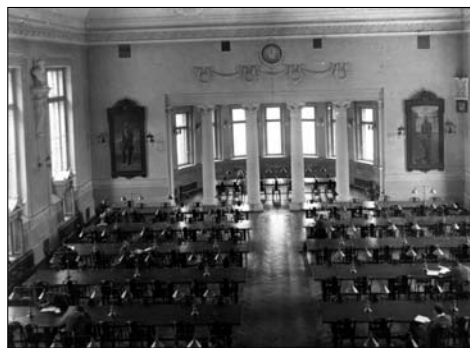
Читальный зал библиотеки

В 1924 г. библиотека вошла в число 11 памятников архитектуры и зданий исторического значения. "Здание Государственной Публичной библиотеки признается лучшим библиотечным зданием на Украине и одним из лучших в Союзе" (Вся Одесса на 1924 год, раздел "Достопримечательности Одессы").