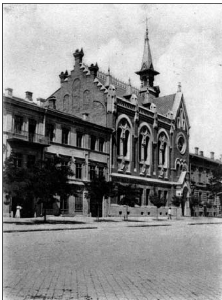
Здание реформатской церкви

30 апреля 1895 года последовала закладка нового здания по плану известного петербургского архитектора академика В. Шретера. Строительство осуществлял инженер Х. Скведер под наблюдением архитектора А. Бернардацци. Новый храм представлял собой трехэтажное здание: на первом этаже находились машины для парового отопления, на втором — квартира пастора, а на третьем — непосредственно молитвенный зал. В 1896 году храм был построен, а в 1900 году окончательно отделан и освящен. "Небольшая, но изящная и стильная церковь, рассчитанная на 500 прихожан" (Г. Москвич. Иллюстрированный практический путеводитель по Одессе. 1904).