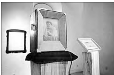
Александр Лисовский Без названия. 1995 г.