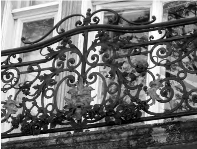
Решетка балкона (деталь)