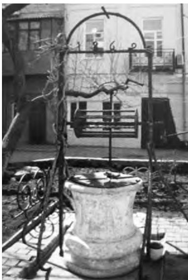
Цистерна во дворе