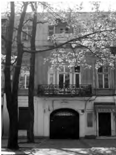
Современное фото дома