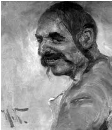
Н.Д. Кузнецов. «П.К. Саксаганский в образе казака»