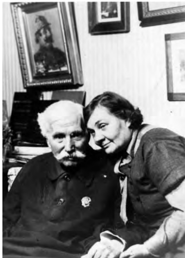
Панас Карпович Саксаганский с женой Ниней Митрофановной Левченко

В настоящее время портреты переданы на хранение в Музей выдающихся деятелей украинской культуры (Киев) и находятся в экспозиции постоянно действующей выставки, посвященной жизни и творчеству Саксаганского, расположенной в помещении