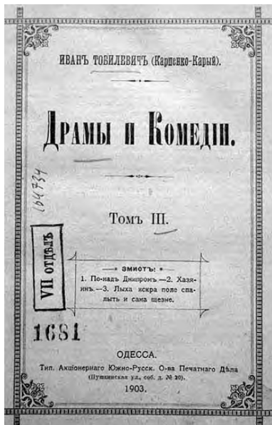
Обложка издания «Драмы и комедии. Том III»

Вот как об этом вспоминал Панас Карпович: «Ще за піст брат написав дві п'єси: «Понад Дніпром» та «Чумаки» і одіслав в цензуру: раніш написану п'єсу «Сербин». Цю п'єсу не дозволили. Карпенко перемінив назву на «Лиха іскра поле спалить і сама щезне» і знову послав «на дибу». Коли я переписував п'єсу, то, роздивляючись заборонений примірник, брат Іван звернув увагу на підпис: «за правителя дел Зюнзя». – «Знаєш, брате, цікаве прізвище: чи не любить ця Зюнзя випить? Зроблю так: пославши до цензури п'єсу, надішлю йому 25 карбованців і напишу, що, здається, забув наліпити марки і ласкаво прошу виправити мою помилку». Так і зроблено. П'єси завжди лежали в цензурному «застінку» по два-три місяці, а дякуючи тому, що Зюнзя «наліпив марки», за літо ми одержали дозволені цензурою «Чумаки» (18 червня 1897 року № 4457), разом прислано і «Понад Дніпром». А «Лиха іскра» дозволена в вересні 1897 р.» 6