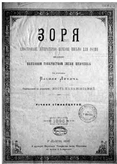
Журнал «Зоря» № 20, 1896 г.

Письмо датировано 1896 годом и написано после посещения Одессы. Гастроли летнего сезона 1896 года «Товарищества русско-малороссийских артистов под управлением А.К. Саксаганского» начались в Николаеве (27.03 – 19.04) и продолжились в Одессе (21.04 – 5.05) 2 . Письмо написано до страстной недели, которая в 1896 году приходилась на период с 18 по 24 марта. Скорее всего, Саксаганский посетил Одессу не в период гастролей, а во время отдыха от представлений в феврале – начале марта 1896 года. Тогда же и было написано письмо.