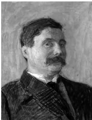
Н.Д. Кузнецов. Портрет П.К. Саксаганского