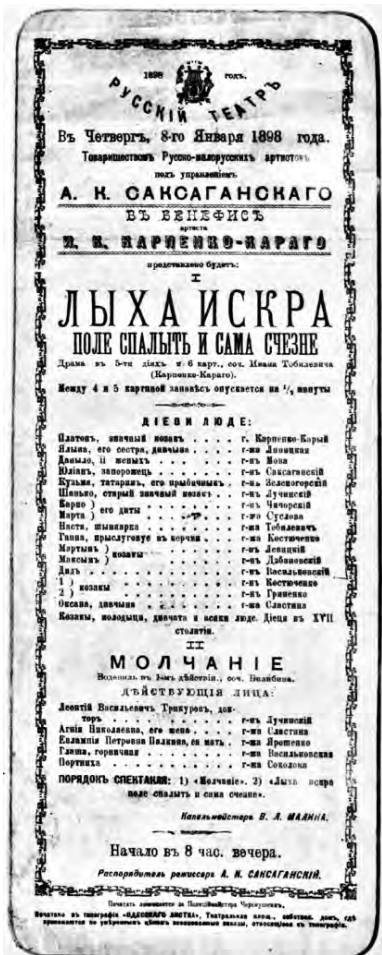
Афиша 1898 г.

из Петербурга, как и предполагалось, перед Пасхой. В письме к своему другу художнику В.Д. Поленову, отправленном из Одессы 4 апреля 1896 года, он упоминает о своем спешном отъезде из Петербурга в связи с болезнью. 4