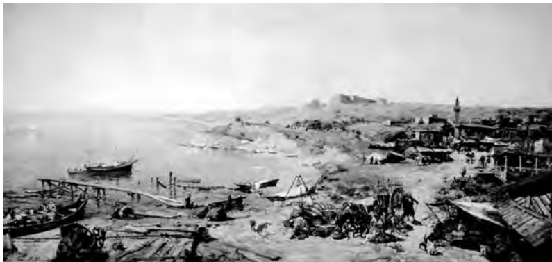
Рис. 2. Натурное изображение древнего турецкого замка (на высоком берегу) и типичного ногайского хутора Хаджибей на месте современной Одессы, предположительно – тогдашнее устье Военной балки. Обращает на себя внимание рыбацкий причал, типичный на одесском побережье Черного моря