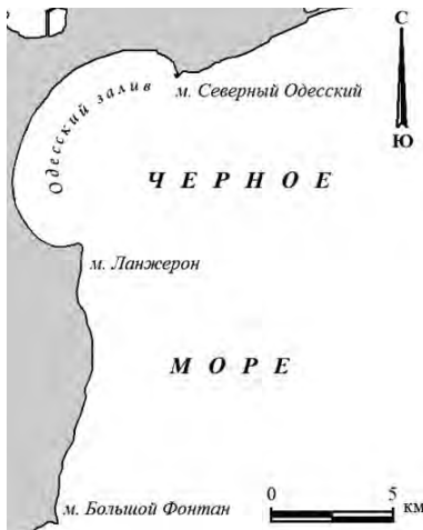
Рис. 1. Схема одесского побережья между м. Бол. Фонтан и Бол. Аджальским лиманом на Черном море в начале XXI века

или Кафы. Судя по апеннинской традиции в Средневековье, в те далекие времена на пустынных колонизованных берегах генуэзцы и венецианцы устраивали в основном небольшие наблюдательные посты, небольшие замки, причем им всегда давались латинские имена, и соседние посты должны были быть в зоне видимости один другого. Для такого поста были очень удобны высокие, хотя и глинистые, мысы Ланжерон и Сев. Одесский (Рис. 1). Видимо, один из таких постов и мог быть впоследствии назван татарами «Хаджи Бей» (или искаженное славянское «Качибей»), по-