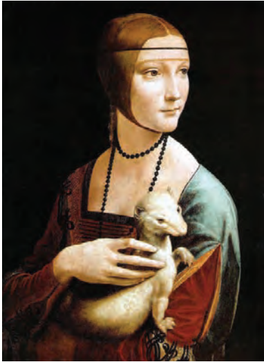
Работа Леонардо да Винчи «Дама с горностаем» временно обитает в одном из вавельских дворцов