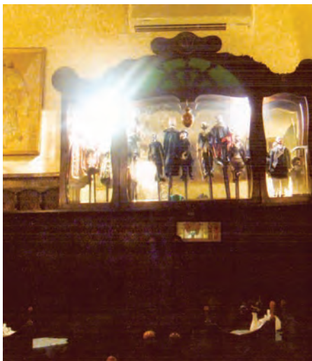
Интерьер в стиле модерн знаменитого кабачка «Яма Михалика»