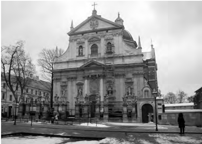
Собор Святых Петра и Павла

точно фрагментарно, но дело в том, что основные составляющие пазла «Собери Краков» расположены на удивление компактно. Мы приглашаем вас совершить прогулку по Дороге королей, само название которой свидетельствует о том, что по этому маршруту следовали те, кому предстояло через несколько часов возглавить государство, большую часть своей истории находившееся в самом центре важнейших событий – драматических, а то и трагических.