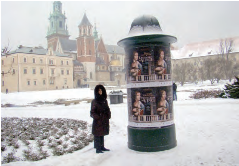
Зимний Вавельский холм...