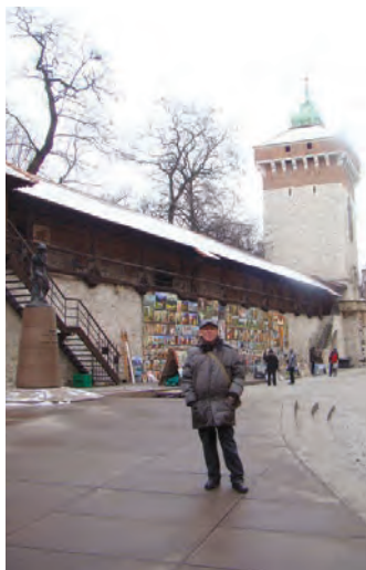
Здесь художники выставляют свои работы у Флорианских ворот