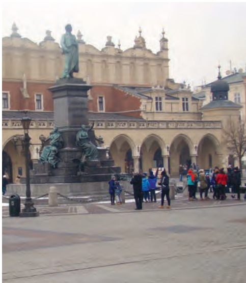
Памятник Адаму Мицкевичу на Рыночной площади