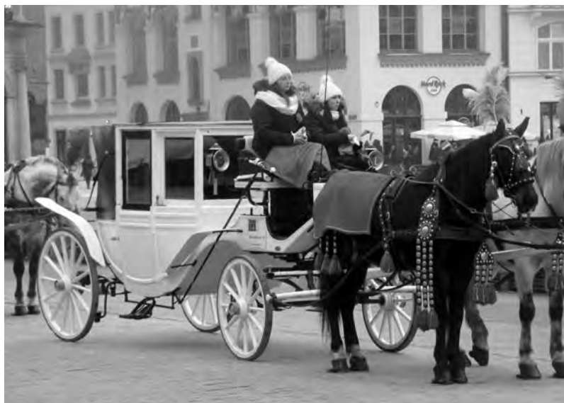
Паненки в капорах приглашают прокатиться

...Мы вернулись на Рыночную площадь, откуда направо – примерно половина пути к Вавельскому замку. И тут я должен особо остановиться на одной из достопримечательностей Кракова. Как и в других европейских городах, центральная площадь – место сбора экипажей, на которых можно совершить прогулку по достопримечательностям города. Как и всюду, лошади украшены сбруей и попонами, поражающими богатством и яркостью отделки, но лишь в Кракове на облучках карет и ландо восседают не дюжие усатые кучера, обычно чуть навеселе, а барышни