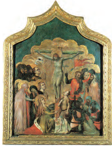
А эта картина кисти неизвестного мастера XIV века – из коллекции здешнего музея