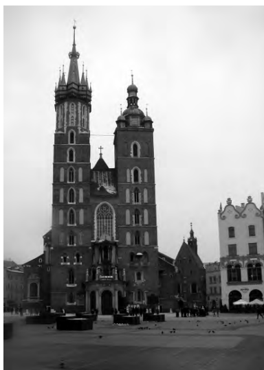
Гордость Кракова – Марицкий собор

Краков – второй после Варшавы польский город, это если сравнивать площадь и население. А вообще, к нему, как и к Одессе, более всего подходит определение «не первый, но и не второй» – по месту и роли в истории не только Польши, но и Европы.