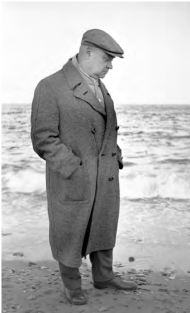
Ланжерон. 1964 г.