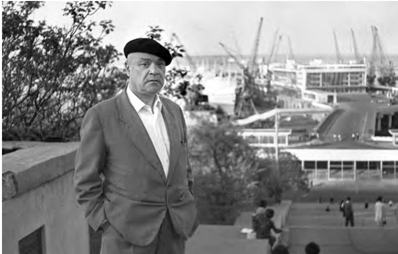
На Потемкинской лестнице