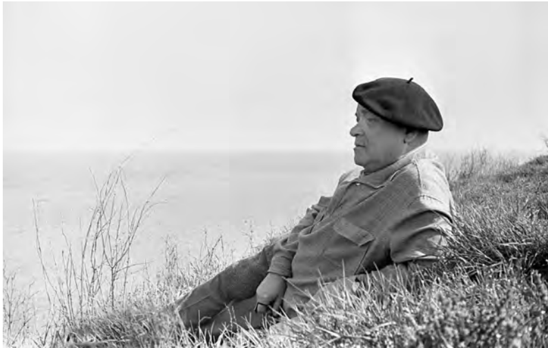
Малый Фонтан. 1965 г.