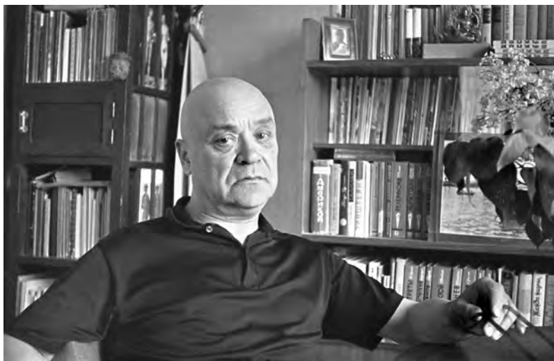
Дома. 1973 г.