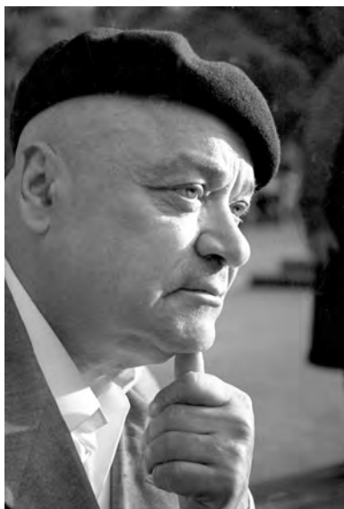
На Соборной площади. Май 1969 г.

перемежались фонограммой с церковными песнопениями и колокольным звоном из мощных динамиков.