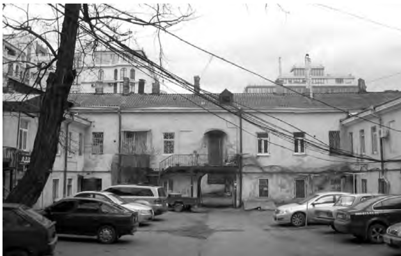
Сохранившиеся дворовые флигели пушкинского времени

купец Марк Андрич , о котором мы еще будем говорить, получил немалую ссуду на построение торговых помещений под залог уже существующей тут недвижимости. 519 Затем место со строениями перешло к упоминавшемуся «митрополиту и кавалеру» Кириллу, которому 5 июня 1822-го Строительный комитет утвердил план и фасад на построение здесь нового дома либо капитальную реконструкцию прежнего. 520