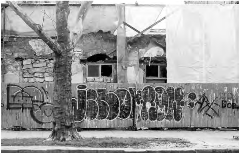
Руины дома Фореггера и Катлея на углу улиц Пушкинской и Жуковского. 2017 г.

эти давно готовые постройки были обмерены. 492 Двухэтажный дом, о котором тут идет речь, подвергся пожару в 2007-м. Я сам наблюдал это происшествие, поскольку как раз находился в расположенном накрест через улицу Облгосархиве. С тех пор здание лежит в руинах, частично подвергшись разборке. Обследование кладок свидетельствует о давности и функциональном назначении постройки: в нижнем этаже располагались лавки с характерными сводчатыми окнами и входами, в верхнем – жилые покои. На внутренней боковой грани здания видны заделанные окна, прежде выходившие во двор, – в ту пору, когда дом на смежном участке по Итальянской улице занимал лишь около половины фасада, то есть когда застройка тут еще не была сплошной.