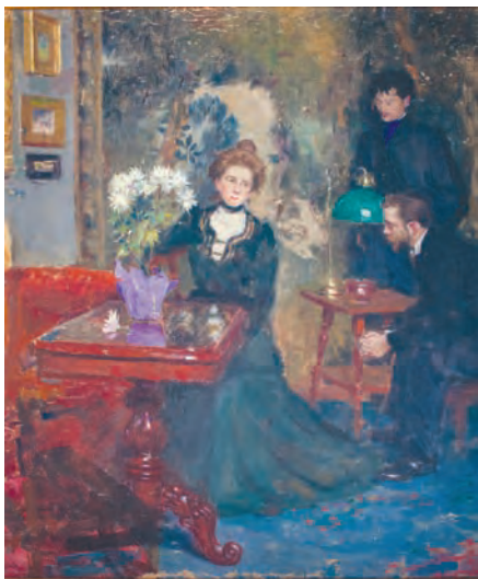
П.А. Нилус. В доме Буковецкого Холст, картон, масло, 50х41 см