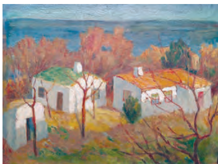
А.Н. Стилиануди. Пейзаж с домами Бумага, масло, 17×25 см