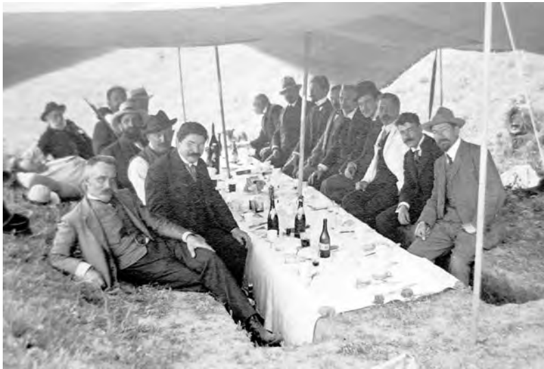
ТЮРХ на пикнике. 1914 год

Значительная часть экспозиции выставки отведена под портретный жанр, и это максимально приближает зрителя к той эпохе, в которой жили и работали художники, дает возможность ощутить дух того времени через характеры и образы портретируемых. Люди разных сословий, возрастов, каждый со своей судьбой и историей, иногда трагичной, нелегкой, порою счастливо сложившейся, изображенные в предреволюционные годы и после, наполняют своей энергетикой пространство выставочного зала.