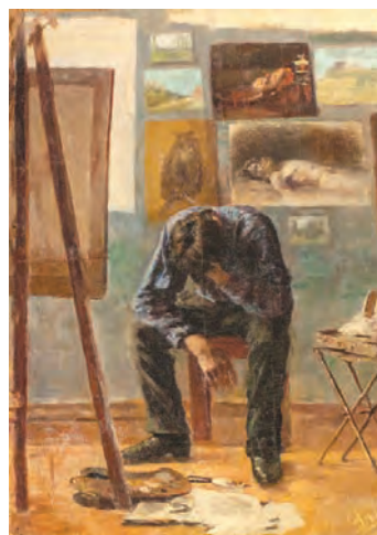
Б.И. Эгиз. В ожидании музыки. Холст, масло, 44×35 см

Все шесть работ, которые мы репродуцируем на этой вкладке, хранятся в частных коллекциях нашего города