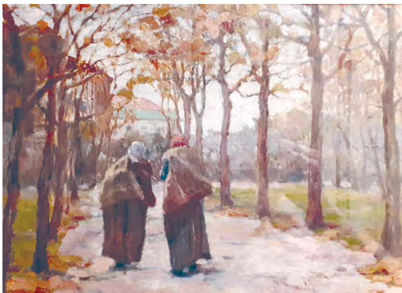
К.К. Костанди. Старухи. Картон, масло, 24×31 см. 1890-е годы