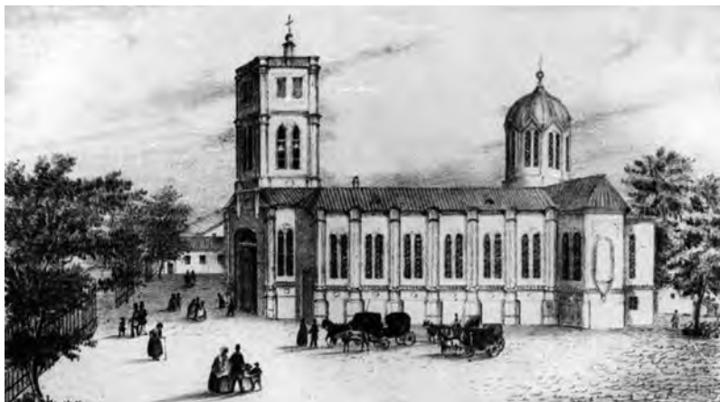
Католический храм после реконструкции начала 1850-х

Здесь уместно еще раз отметить, что авторитетный К.Н. Смольянинов, работавший с архивными документами в начале 1850-х в ходе написания «Истории Одессы», утраченные позже дела держал руках. Он прямо говорит о том, что капитальный Католический храм заложен в 1802 году, а в 1804-м при активном содействии де Ришелье сооружение продолжилось. 933 Далее. Вступая в должность, герцог Ришелье запросил все имеющиеся статистические данные о состоянии Одессы и получил точную информацию. Так вот там упоминаются и недостроенные каменные церкви: две русских и одна католическая. 934