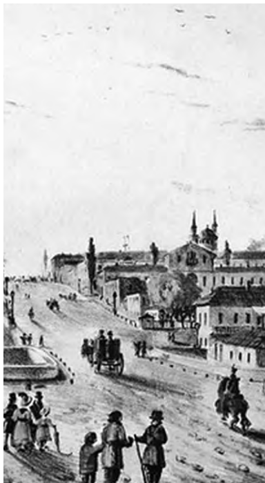
Фрагмент гравюры Боссоли 1836 г. Справа вверху различим первозданный костел